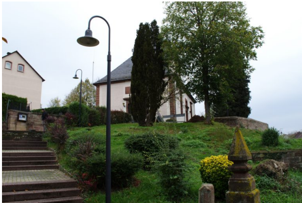
Blick von der Hauptstraße in Richtung des Hauptportals der Martin Luther-Kirche