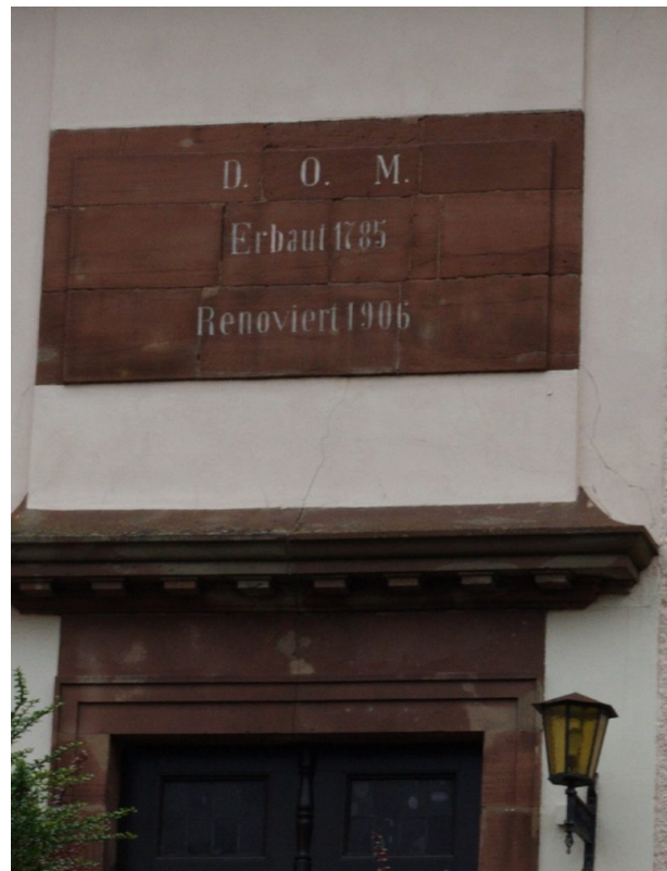
Inschrifttafel mit Erbauungs- und Renovierungsjahr über dem Hauptportal der Martin Luther-Kirche in Contwig (Peter Conzelmann, 2003)