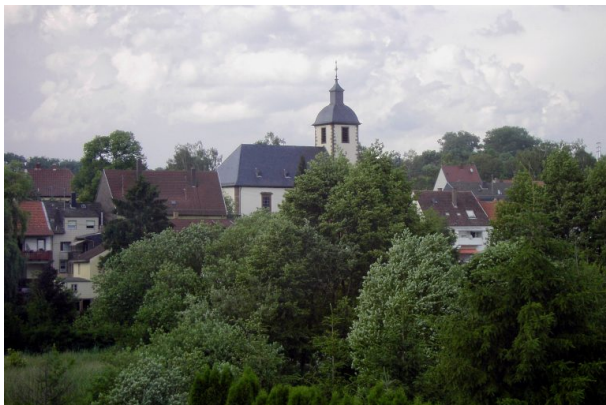
Martin Luther-Kirche in Contwig (Peter Conzelmann, 2003)

Peter Conzelmann am 29.10.2019 um 13:30:27Uhr