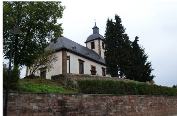
Blick von der Hauptstraße auf die etwas erhöht gelegene Martin Luther-Kirche (Peter Conzelmann, 2003)