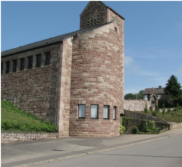
Christuskirche in Stambach (Peter Conzelmann, 2007)