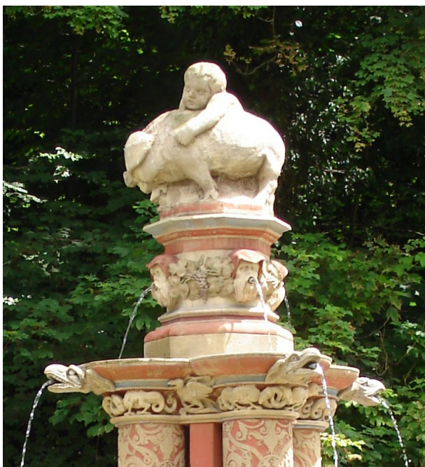
Albrechtsbrunnen - Knabe mit Ferkel (Manfred Grad, 2019)