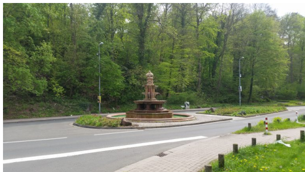
Albrechtsbrunnen in der Bremerstraße (Sonja Kasprick, 2019)