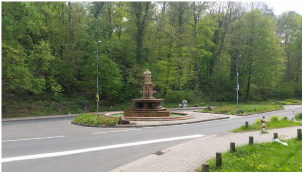
Albrechtsbrunnen in der Bremerstraße (Sonja Kasprick, 2019)