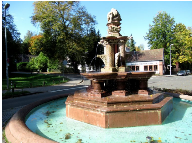
Albrechtsbrunnen total (Manfred Grad, 2019)