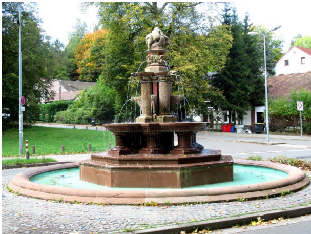
Albrechtsbrunnen total (Manfred Grad, 2019)