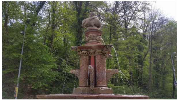
Albrechtsbrunnen - Säulen mit Sandsteinplastik "Knabe mit Ferkel".