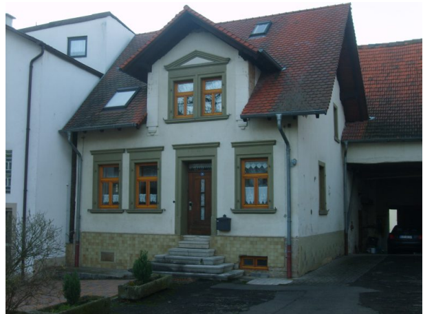
Gebäude der ehemaligen Poststation (OG Hinzweiler/ Werner Lang, 2014)