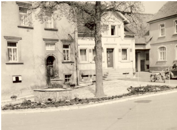
Poststation im Jahr 1950 (OG Hinzweiler/ Werner Lang, 1950)