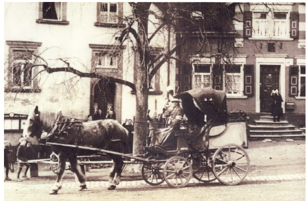
Postkutsche vor der Poststation in den 1930er Jahren (1933)