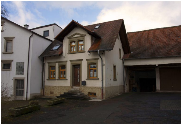
Gebäude der ehemaligen Poststation (Sonja Kasprick, 2020)