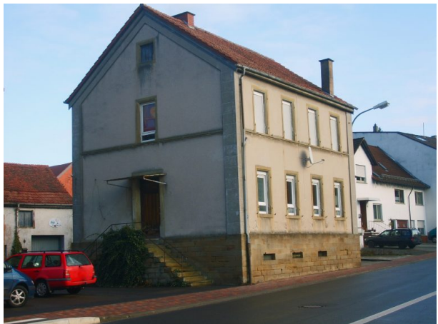
Altes Schulhaus in Hinzweiler (OG Hinzweiler/ Werner Lang, 2014)