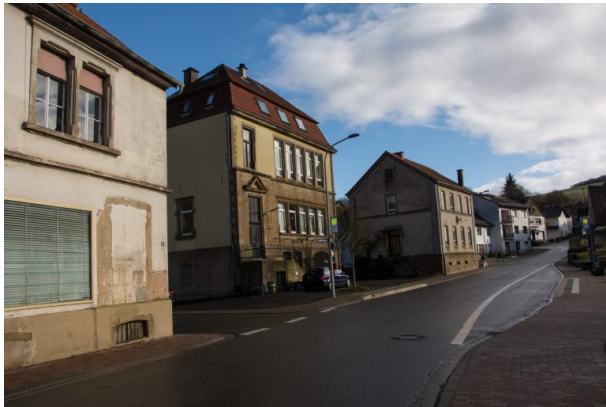
Im Hintergrund das alte Schulhaus an der Hauptstraße von Hinzweiler. Davor das neue Schulhaus (Sonja Kasprick, 2020)