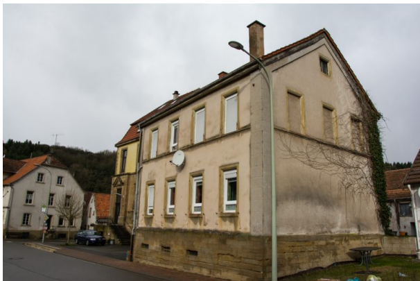
Altes Schulhaus in Hinzweiler (Sonja Kasprick, 2020)