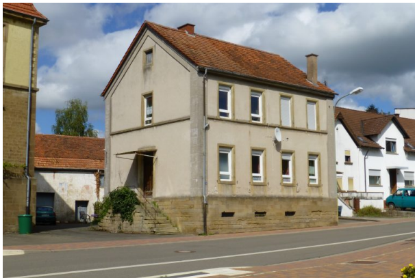
Altes Schulhaus in Hinzweiler (OG Hinzweiler/ Werner Lang, 2014)