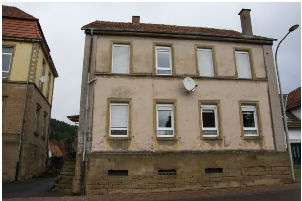
Frontansicht des alten Schulhauses. Am linken Bildrand das neue Schulhaus