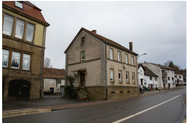
Altes Schulhaus in Hinzweiler. Am linken Bildrand das neue Schulhaus (Sonja Kasprick, 2020)