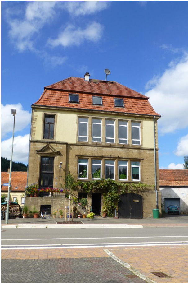
Neues Schulhaus in Hinzweiler (Ort Hinzweiler/Lang, 2014)