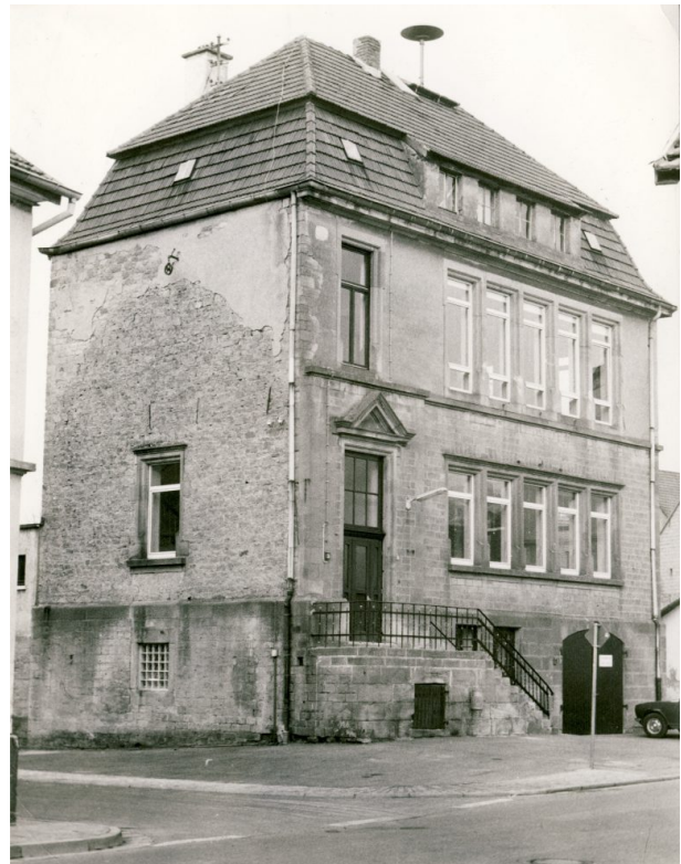
Neues Schulhaus in Hinzweiler um 1990 (Ort Hinzweiler/Lang, um 1990)