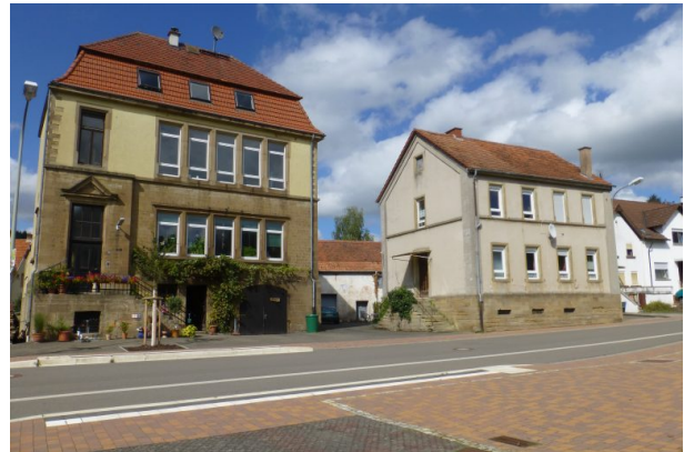
Links ist das neue Schulhaus zu sehen, rechts das alte Schulhaus in Hinzweiler (Ort Hinzweiler/Lang, 2015)