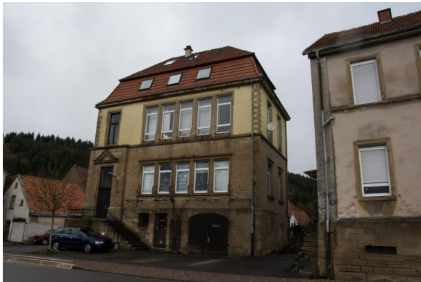
Neues Schulhaus in Hinzweiler (Sonja Kasprick, 2020)