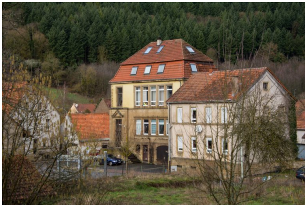
Links ist das neue Schulhaus zu sehen, rechts das alte Schulhaus in Hinzweiler (Sonja Kasprick, 2020)