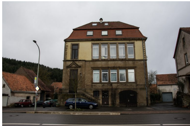
Neues Schulhaus in Hinzweiler (Sonja Kasprick, 2020)