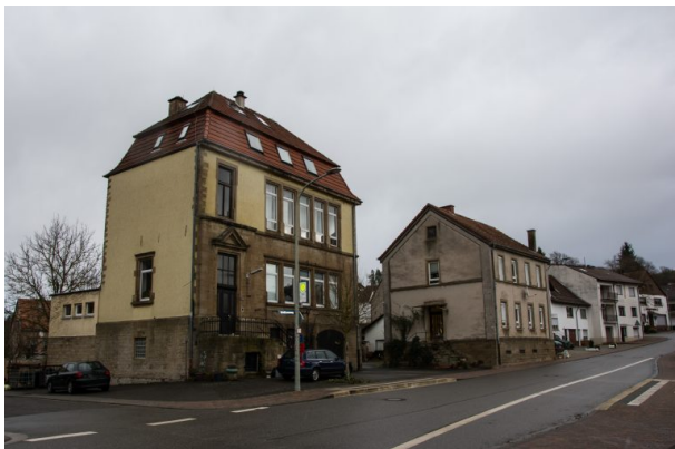
Links ist das neue Schulhaus zu sehen, rechts das alte Schulhaus in Hinzweiler (Sonja Kasprick, 2020)