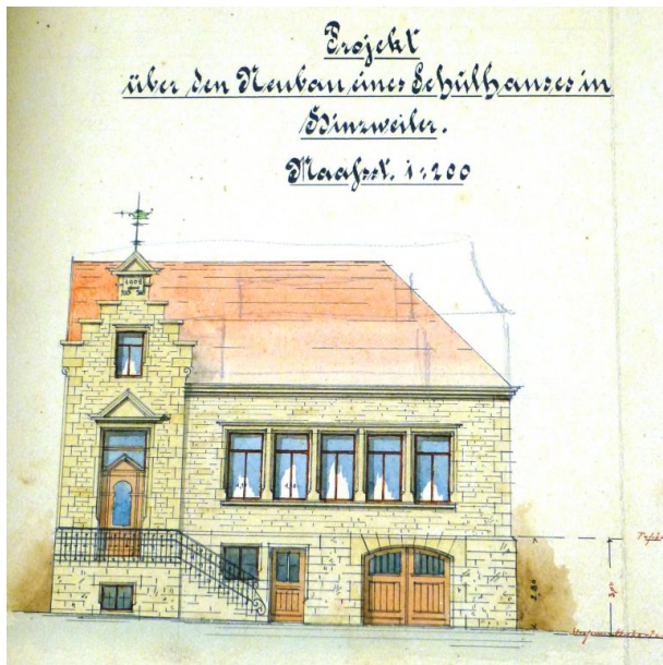
Bauplan des neuen Schulhauses von 1902 (Ort Hinzweiler/Lang)