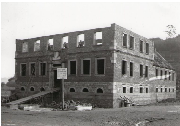
Das zweite Geschoss war fast fertig (Unbekannt, 1926/27)