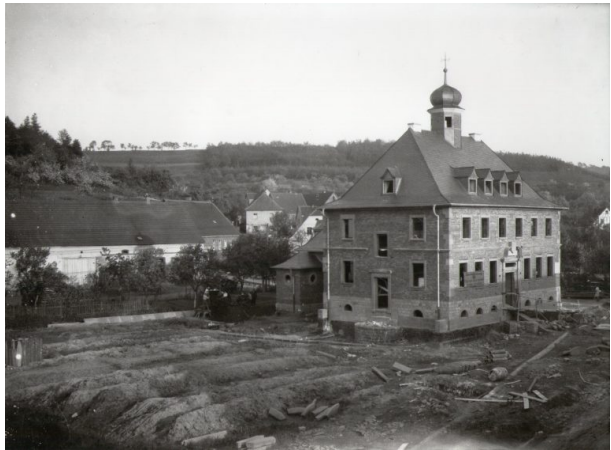
Baufortschritt Frühsommer 1927 (Unbekannt, 1927)