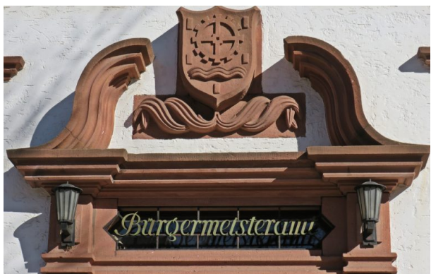
Ortswappen mit Sandsteinfries über der Eingangstür des Rathauses in Erfenbach (Helge Ebling, 2018)