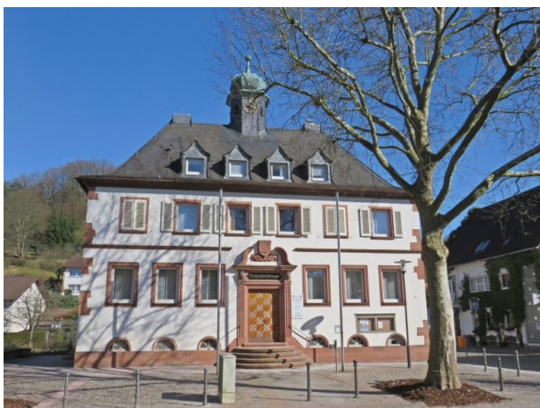
Rathaus in Erfenbach (Helge Ebling, 2018)

Helge Ebling am 03.02.2020 um 09:03:48Uhr