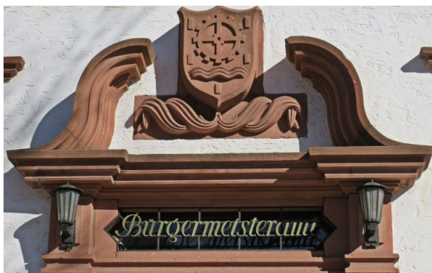
Ortswappen mit Sandsteinfries über der Eingangstür des Rathauses in Erfenbach (Helge Ebling, 2018)