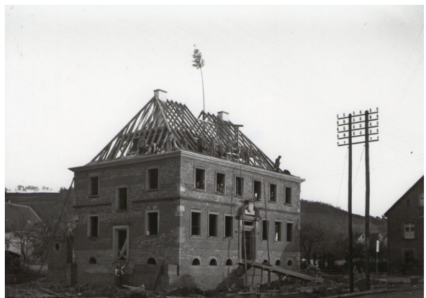
Richtfest (Unbekannt, 1926/27)