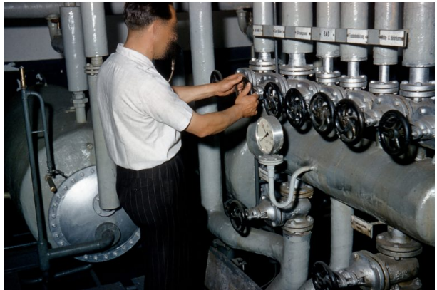
Heizsystem des Volksbads (Hubert Schneider, 1959)