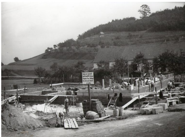
Die schweren Sandsteinblöcke des Kellergeschosses wurden ohne maschinelle Hilfe aufgemauert (Unbekannt, um 1926)