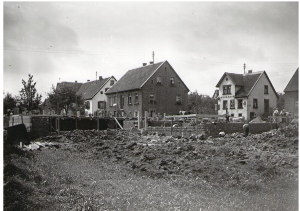
Maurerarbeiten am Kellergeschoss (Unbekannt, um 1926)