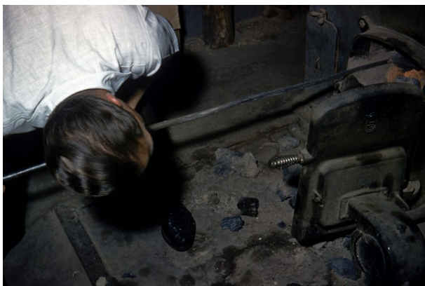
Heizung des Volksbads (Hubert Schneider, 1959)