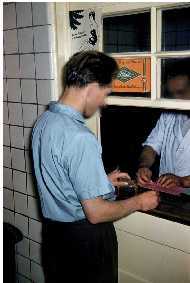
Kasse des Volksbads (Hubert Schneider, 1959)