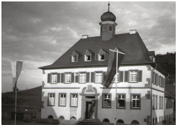
Fertiggestelltes Rathaus (Unbekannt, 1927)