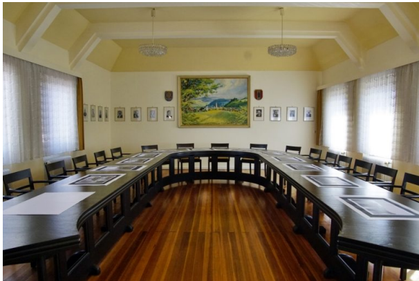
Ratssaal des Erfenbacher Rathauses (Helge Ebling, 2018)