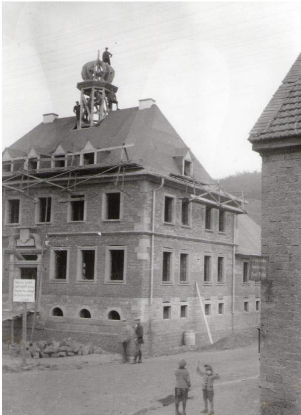
Am Zwiebelturm wird gearbeitet (Unbekannt, 1926/27)