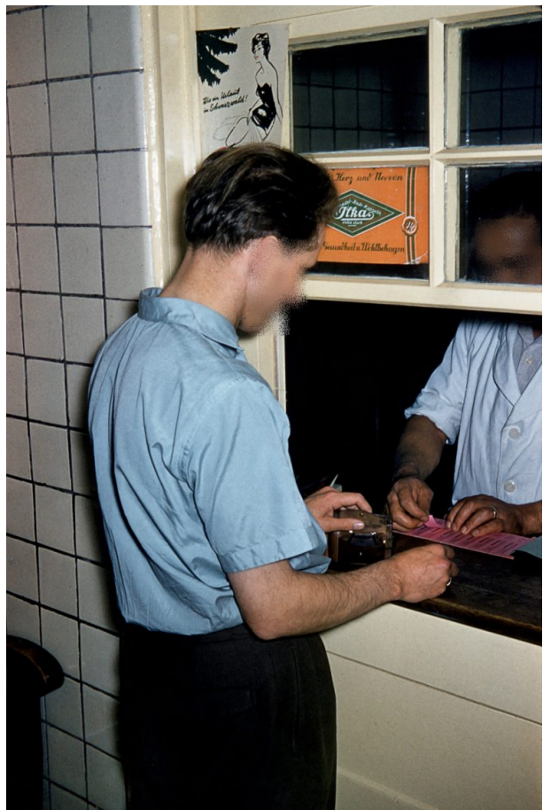
Kasse des Volksbads (Hubert Schneider, 1959)