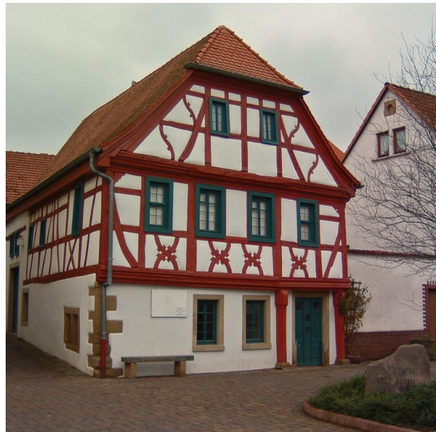
Das Steinhauermuseum in Alsenz ist die erste Station des Steinhauerrundweges in Alsenz (VG Alsenz-Obermoschel, 2008)