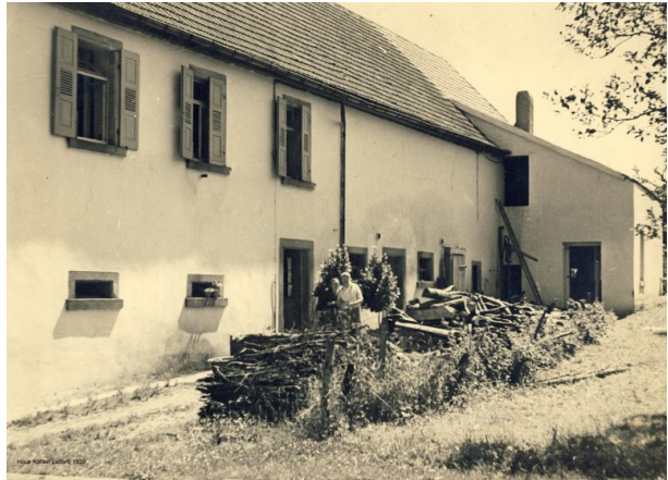
Rückseite der Schreinerei Köhler (OG Hinzweiler/ Werner Lang, 1939)