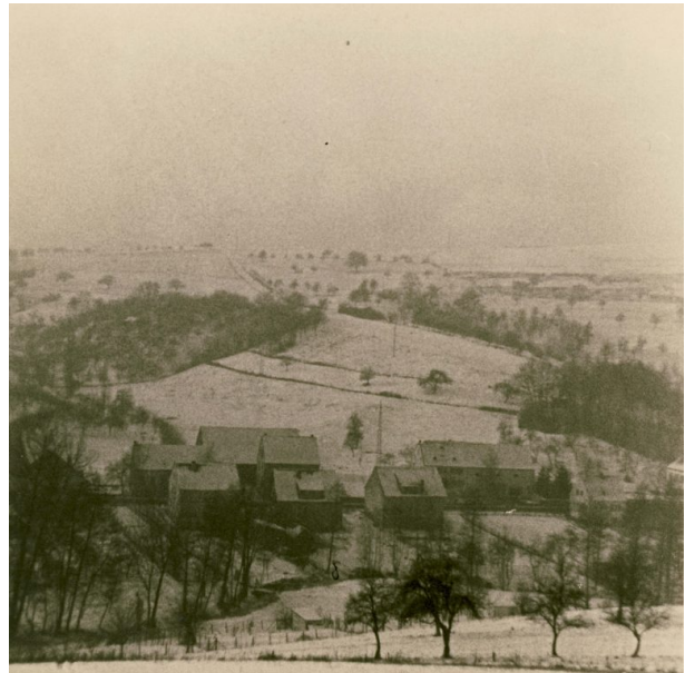
Blick auf Hinzweiler mit Schreinerei Köhler im Winter (OG Hinzweiler/ Werner Lang, 1971)