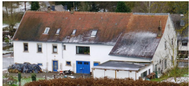
Rückseite der ehemaligen Schreinerei