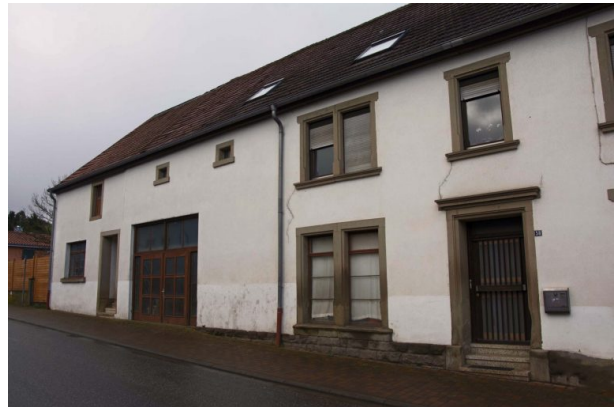
Ehemalige Schreinerei Köhler in der Hauptstraße von Hinzweiler (Sonja Kasprick, 2020)