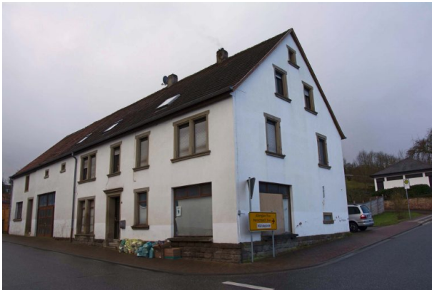
Ehemalige Schreinerei Köhler in der Hauptstraße von Hinzweiler (Sonja Kasprick, 2020)