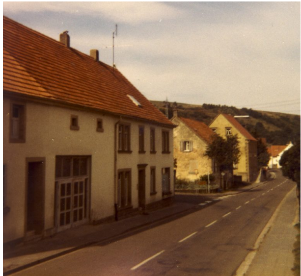
Schreinerei Köhler Anfang der 1970er Jahre (OG Hinzweiler/ Werner Lang, um 1975)