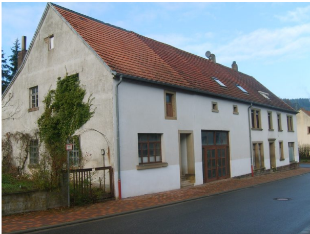
Ehemalige Schreinerei Köhler in der Hauptstraße von Hinzweiler (OG Hinzweiler/ Werner Lang, 2013)