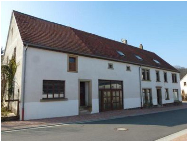
Ehemalige Schreinerei Köhler in der Hauptstraße von Hinzweiler (OG Hinzweiler/ Werner Lang, 2013)