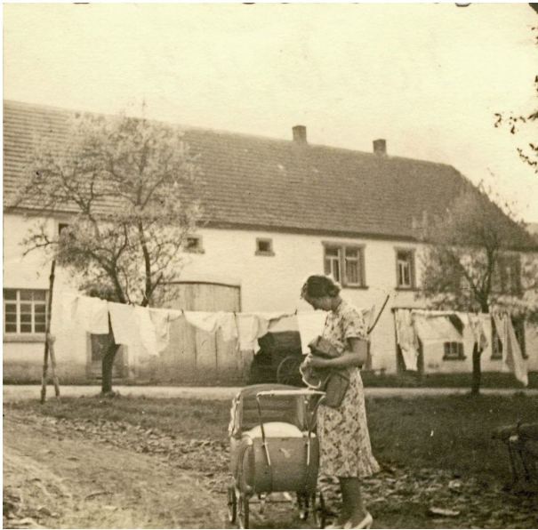
Im Hintergrund die Schreinerei Köhler (OG Hinzweiler/ Werner Lang, 1940)