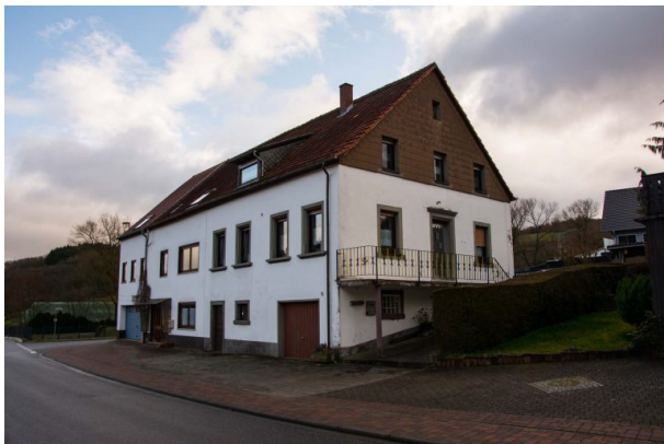
Haus "Nickelpetersch" in der Hauptstraße 5 in Hinzweiler - Südansicht (Sonja Kasprick, 2020)