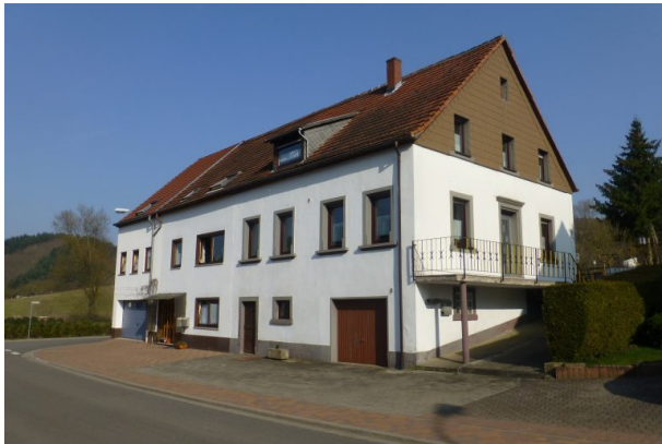
Haus "Nickelpetersch" in der Hauptstraße 5 in Hinzweiler - Südansicht (OG Hinzweiler/ Werner Lang, 2014)