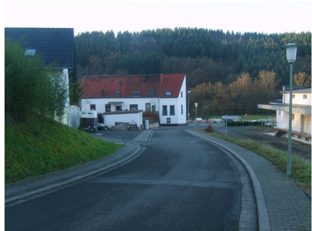
Rückansicht von der Bergstraße in Hinzweiler auf das Haus "Nickelpetersch" in der Hauptstraße 5