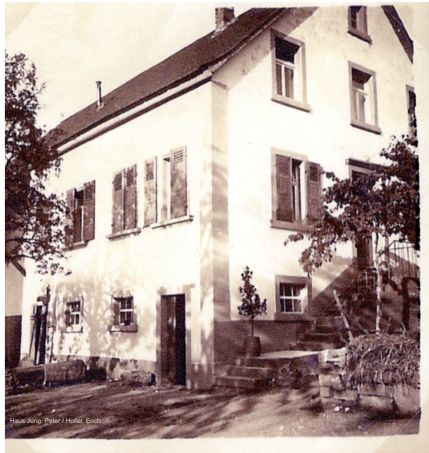
Bauernhaus Jung (OG Hinzweiler/ Werner Lang, 1920er Jahre)