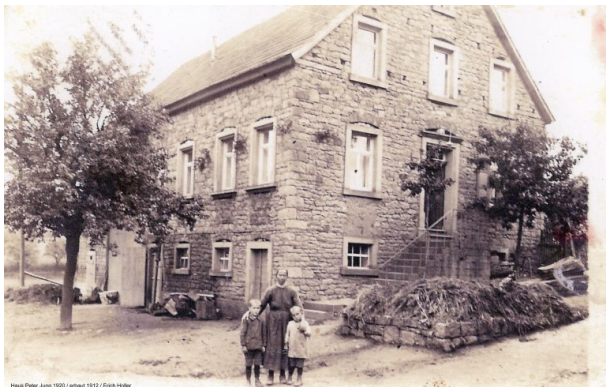
Bauernhaus Jung (OG Hinzweiler/ Werner Lang, 1915)