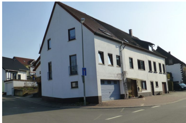
Haus "Nickelpetersch" in der Hauptstraße 5 in Hinzweiler - Nordansicht