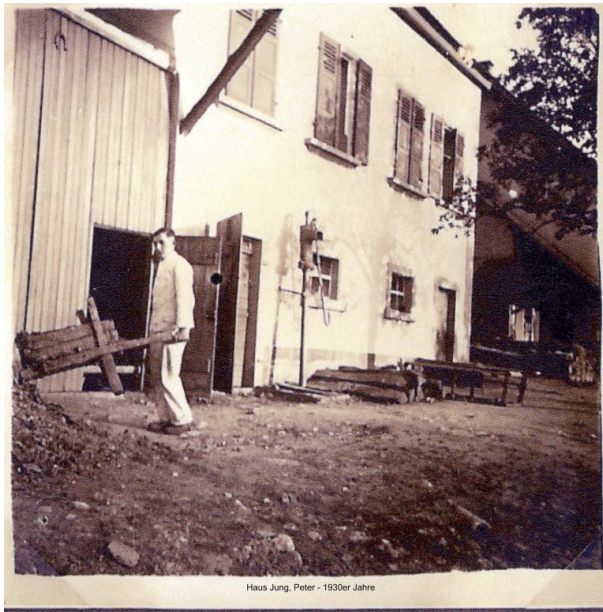
Bauernhaus Jung (OG Hinzweiler/ Werner Lang, 1930er Jahre)