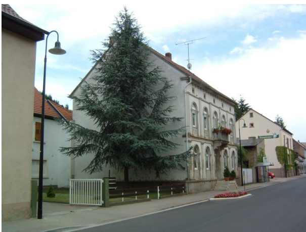
Haus Bohley in Alsenz (VG Alsenz-Obermoschel, um 2008)

Sonja Kasprick am 28.01.2020 um 15:03:34Uhr