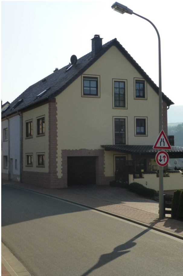
Nordansicht - Bauernhaus in der Hauptstraße 14a (OG Hinzweiler/ Werner Lang, 2014)