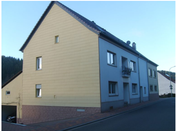
Südansicht - Bauernhaus Hauptstraße 14 (OG Hinzweiler/ Werner Lang, 2014)