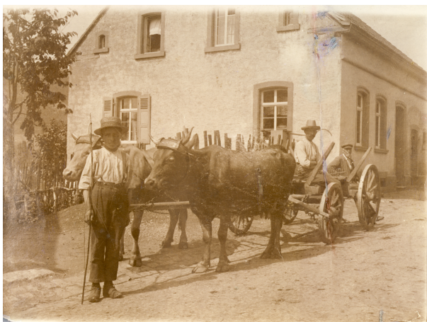
Südansicht - Bauernhaus in den 1940er Jahren mit Kuhgespann (OG Hinzweiler/ Werner Lang, um 1945)