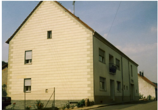
Südansicht - Bauernhaus Hauptstraße 14 (OG Hinzweiler/ Werner Lang, 1982)