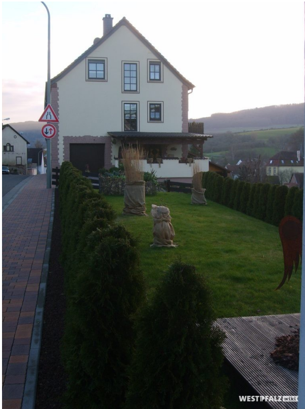
Nordansicht - Bauernhaus in der Hauptstraße 14a (OG Hinzweiler/ Werner Lang, 2014)