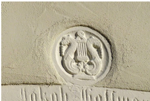
Lyra über der Eingangstür (OG Hinzweiler/ Werner Lang, 2014)