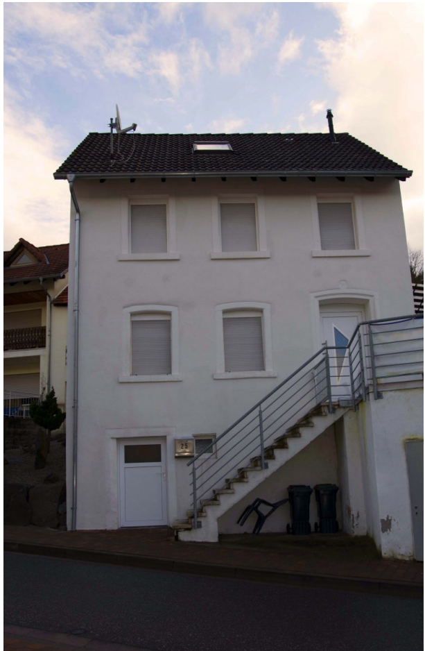
Ehemaliges Musikantenhaus von der Hauptstraße