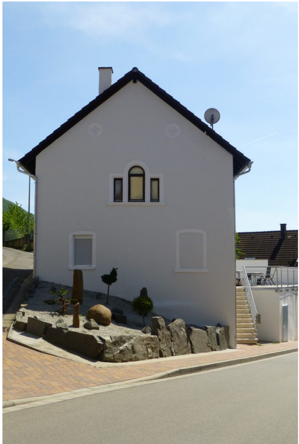
Musikantenhaus Hauptstraße 25 - Seitenansicht