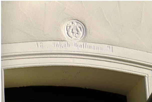
Türinschrift mit Lyra (OG Hinzweiler/ Werner Lang, 2014)