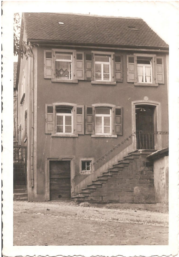
Historische Aufnahme des ehemaligen Musikantenhauses (OG Hinzweiler/ Werner Lang, um 1940)