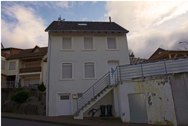
Ehemaliges Musikantenhaus von der Hauptstraße