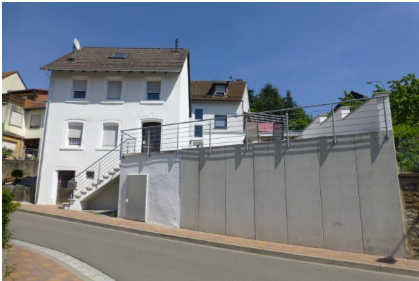
Ehemaliges Musikantenhaus mit neugestaltetem Außenbereich von der Hauptstraße