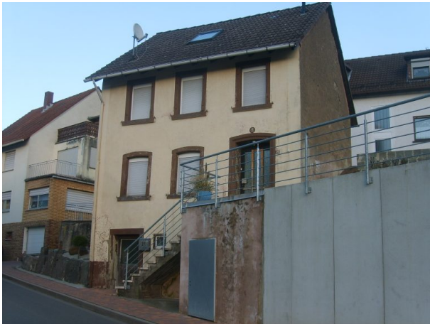
Hauptstraße 25 vor der Neugestaltung