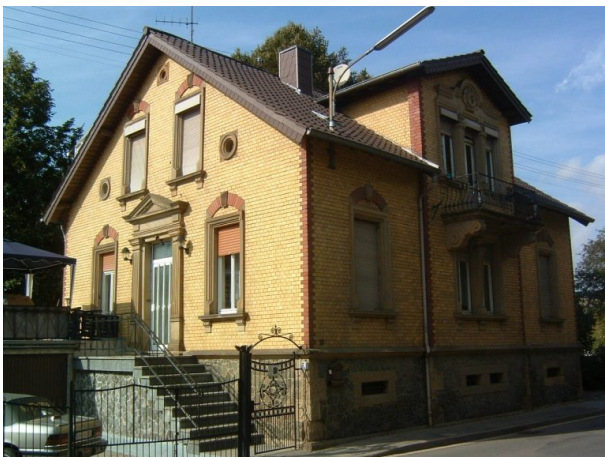
Haus Essig-Alexander in Alsenz (VG Alsenz-Obermoschel)

Sonja Kasprick am 28.01.2020 um 15:58:59Uhr