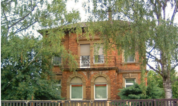
Haus Freyer in Alsenz (VG Alsenz-Obermoschel, um 2008)

Sonja Kasprick am 29.01.2020 um 08:30:56Uhr