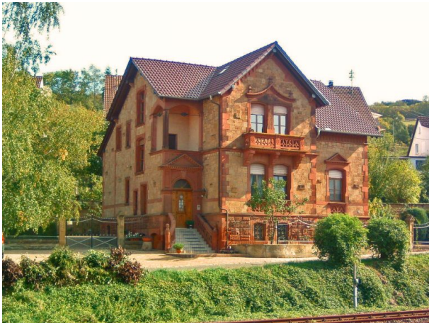
Wohnhaus der Gebrüder Spuhler in Alsenz (VG Alsenz-Obermoschel, um 2008)