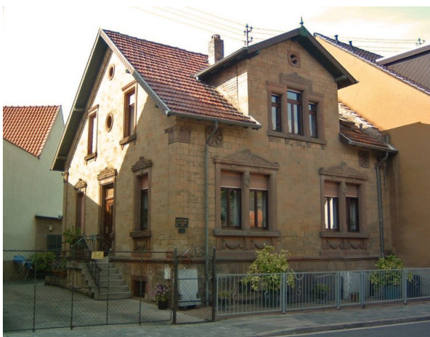
Das ehemalige Wohn- und Geschäftshaus Zepp (VG Alsenz-Obermoschel, um 2008)

Sonja Kasprick am 29.01.2020 um 11:04:55Uhr