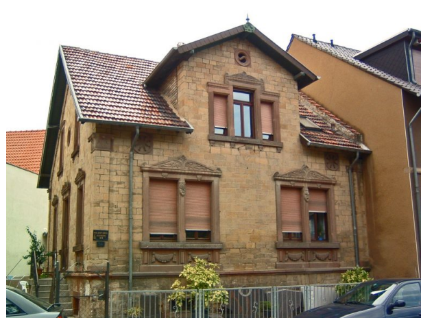
Das ehemalige Wohn- und Geschäftshaus Zepp (VG Alsenz-Obermoschel, um 2008)