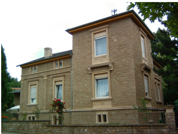
Haus Heiderich in Alsenz (VG Alsenz-Obermoschel, um 2008)

Sonja Kasprick am 29.01.2020 um 11:11:20Uhr