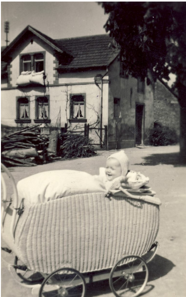
Im Hintergrund das ehemalige Musikantenhaus von Peter Hahn in Hinzweiler (OG Hinzweiler/ Werner Lang, 1952)