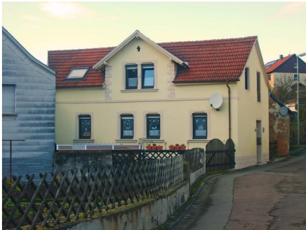
Ehemaliges Musikantenhaus in Hinzweiler (OG Hinzweiler/ Werner Lang, 2014)