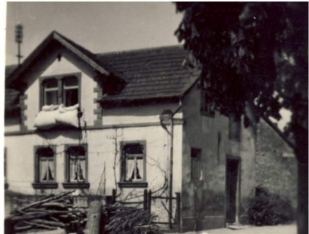
Ehemaliges Musikantenhaus in Hinzweiler (OG Hinzweiler/ Werner Lang, 1952)