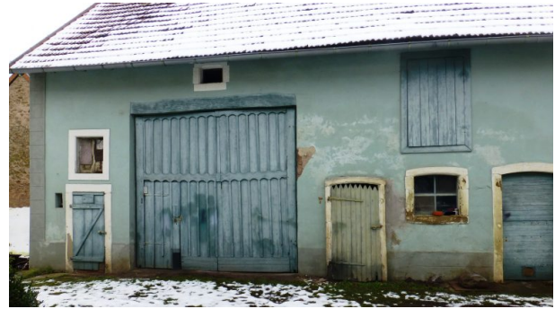
Wirtschaftsgebäude des ehemaligen Musikantenhauses (OG Hinzweiler/ Werner Lang, 2014)