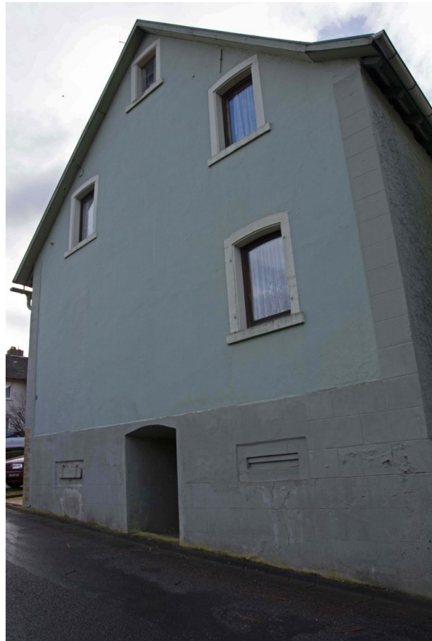
Giebelseite des Wohnhauses - Straßenansicht (Sonja Kasprick, 2020)