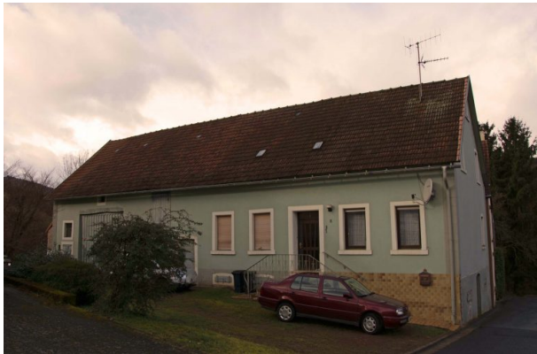
Ehemaliges Musikantenhaus Jakob Schwarz (Sonja Kasprick, 2020)