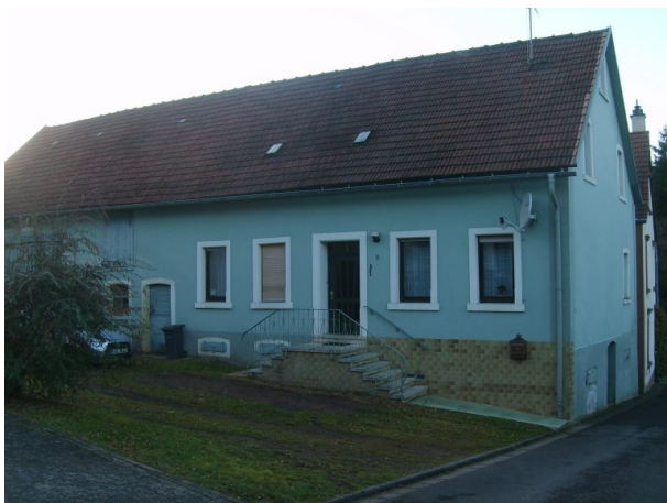
Ehemaliges Musikantenhaus Jakob Schwarz (OG Hinzweiler/ Werner Lang, 2015)