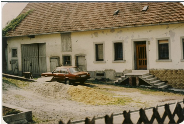
Ehemaliges Musikantenhaus Jakob Schwarz (OG Hinzweiler/ Werner Lang, 1982)