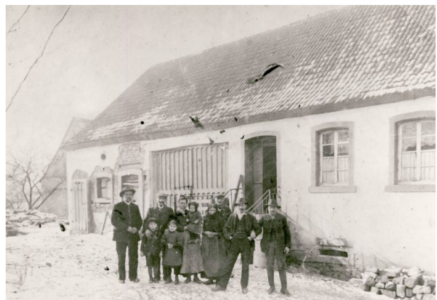
Familie Schwarz vor ihrem Haus Mühlberg 8 in Hinzweiler (OG Hinzweiler/ Werner Lang, 1912)