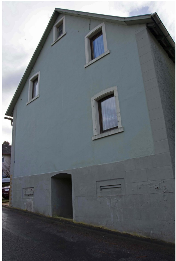
Giebelseite des Wohnhauses - Straßenansicht (Sonja Kasprick, 2020)