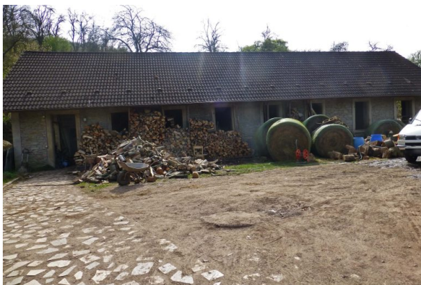
Wirtschaftsgebäude des einstigen Kalkwerks (OG Hinzweiler/ Werner Lang, 2014)