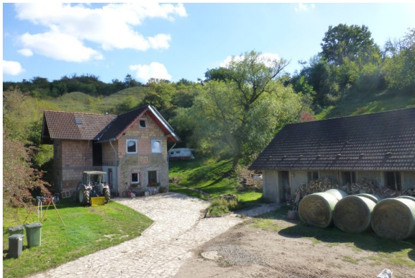
Ehemaliges Kalkwerk Hein bei Hinzweiler (OG Hinzweiler/ Werner Lang, 2015)