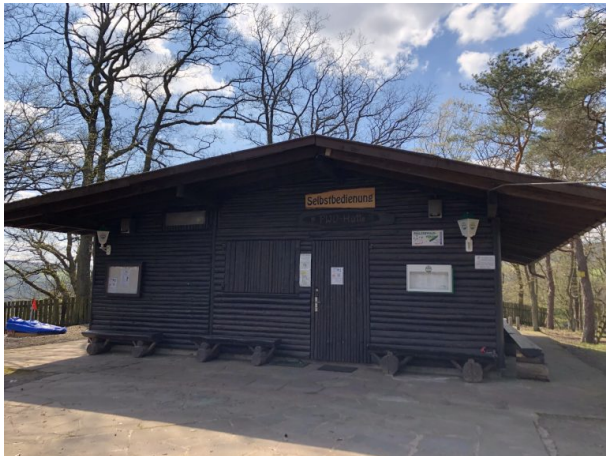
PWV-Hütte in Olsbrücken (Dana Taylor, 2020)