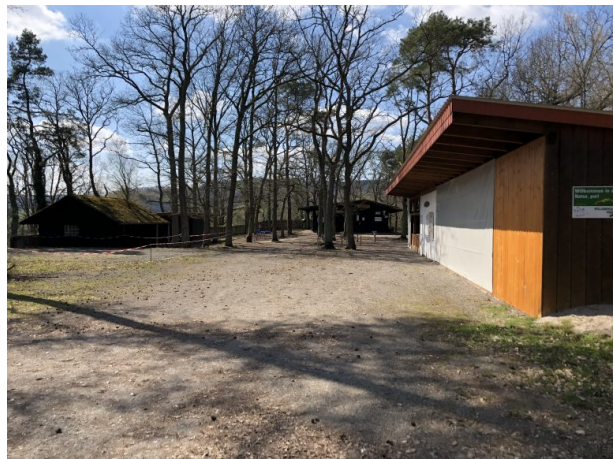
Areal des PWV Olsbrücken (Dana Taylor, 2020)