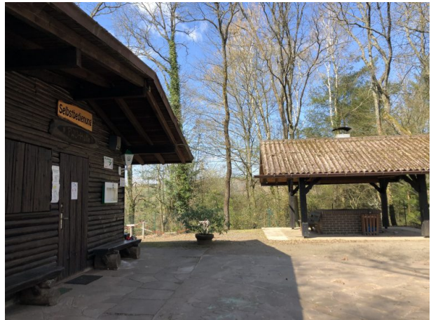
PWV-Hütte und Grillplatz (Dana Taylor, 2020)