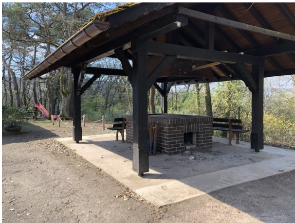
Grillplatz an der PWV-Hütte Olsbrücken (Dana Taylor, 2020)