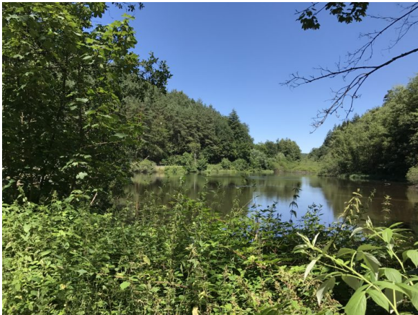
Moosalbweiher am Oberhammer (Marcel Krupka, 2019)