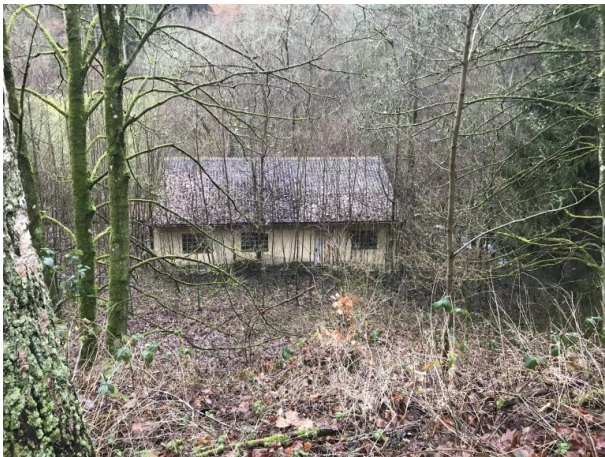
Altes Pumpwerk am Oberhammer (Marcel Krupka, 2020)