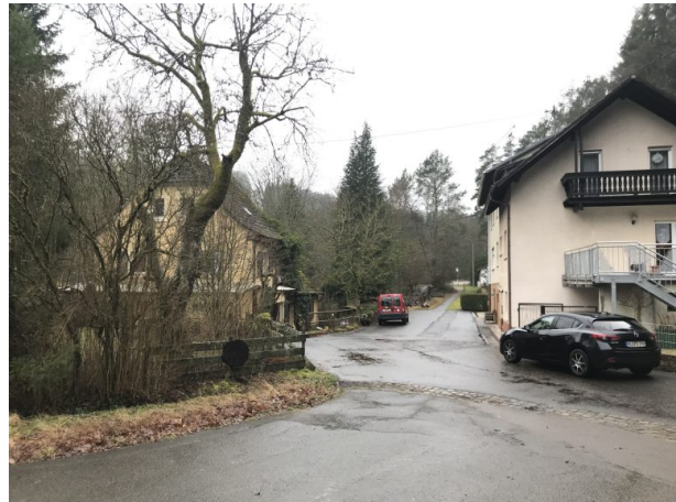
Heutige Wohngebäude am Oberhammer (Marcel Krupka, 2020)