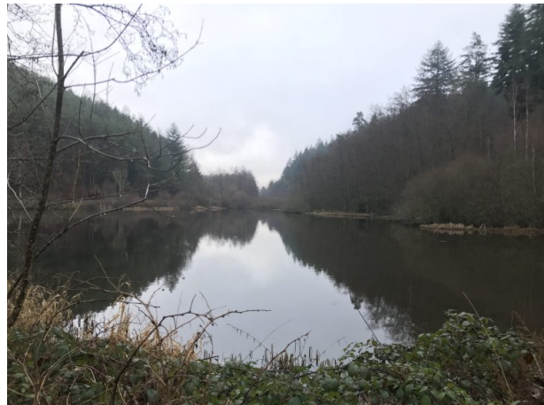
Moosalber Weiher am Oberhammer (Marcel Krupka, 2020)