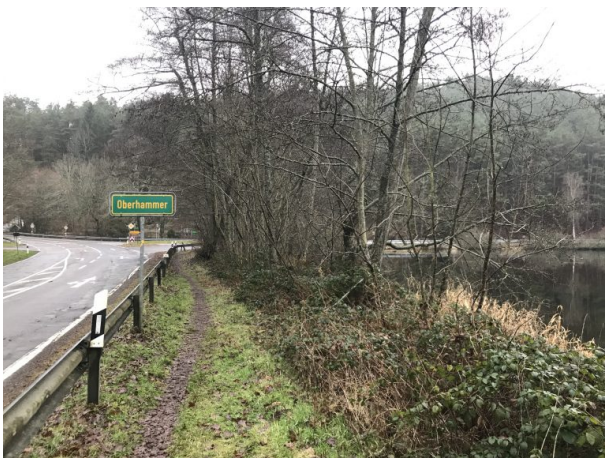
Oberhammer (Marcel Krupka, 2020)