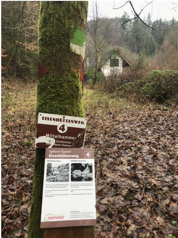
Infotafel am Mittelhammer (Marcel Krupka, 2020)