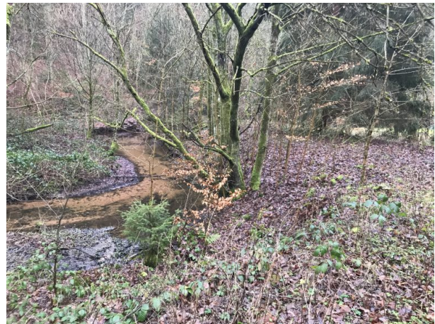
Früherer Damm des Weihers am Mittelhammer (Marcel Krupka, 2020)