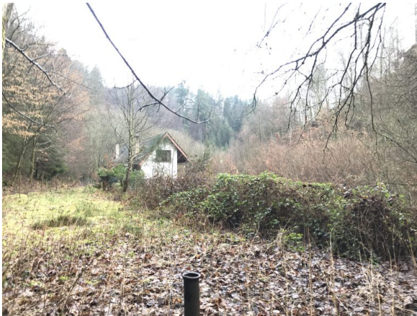
Mittelhammer (Marcel Krupka, 2020)

Marcel Krupka / Artur Bomke am 09.02.2020 um 16:09:33Uhr