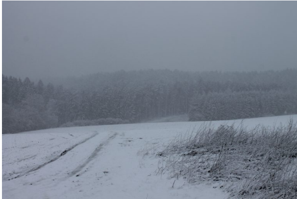
Sicht vom Wilensteiner Feld auf das Winzer Tal (Marcel Krupka, 2020)