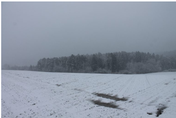
Sicht vom Wilensteiner Feld auf das Winzer Tal (Marcel Krupka, 2020)