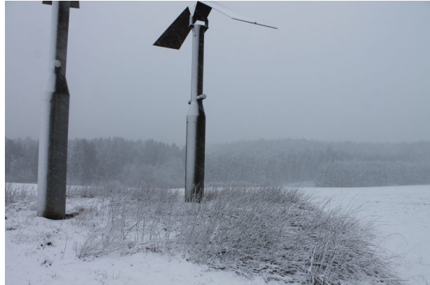
Sicht von der Skulptur "Balzgeflüster" auf das Winzer Tal (Marcel Krupka, 2020)