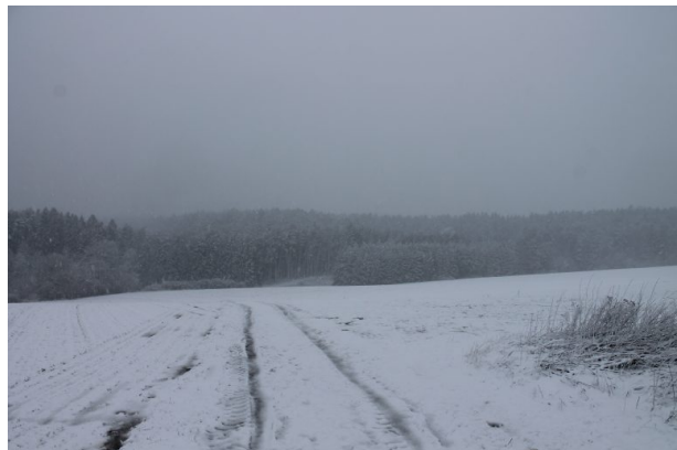
Sicht vom Wilensteiner Feld auf das Winzer Tal (Marcel Krupka, 2020)