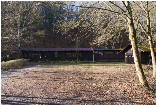
PWV-Hütte in Hinzweiler (Sonja Kasprick, 2020)