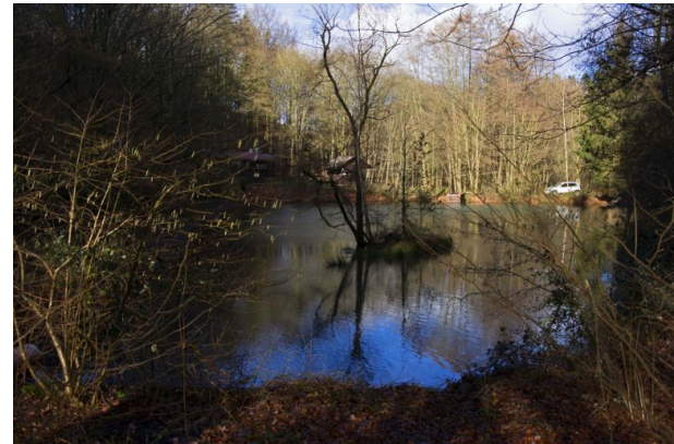
Fischweiher an der Waldvereinshütte (Sonja Kasprick, 2020)