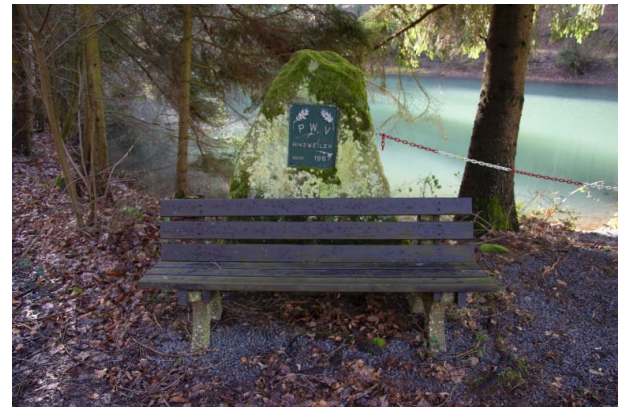
Sitzgelegenheit am Fischerweiher bei der PWV-Hütte in Hinzweiler (Sonja Kasprick, 2020)