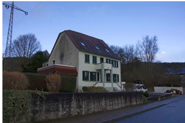
Altes Pfarrhaus in der Hauptstraße 50 in Hinzweiler (Sonja Kasprick, 2020)