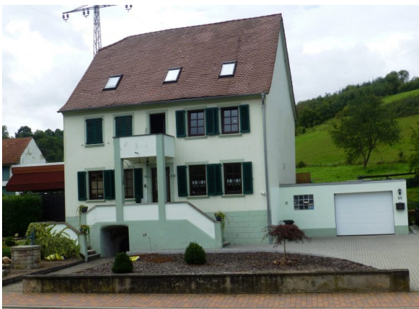
Altes Pfarrhaus in der Hauptstraße 50 in Hinzweiler