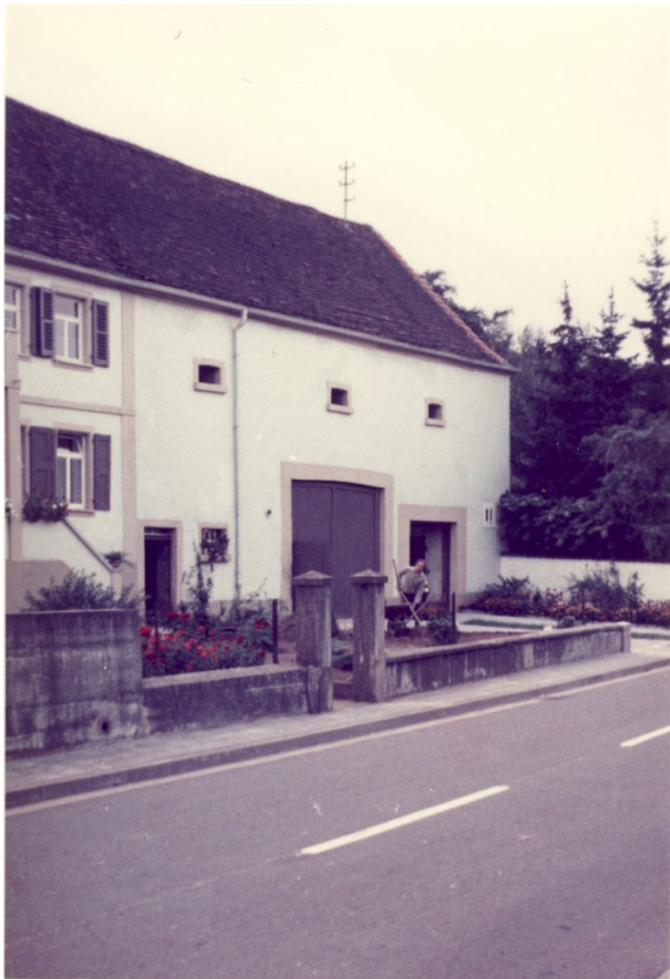
Altes Pfarrhaus mit angebauter Scheune in der Hauptstraße 50 in Hinzweiler (OG Hinzweiler/Werner Lang, 1970)