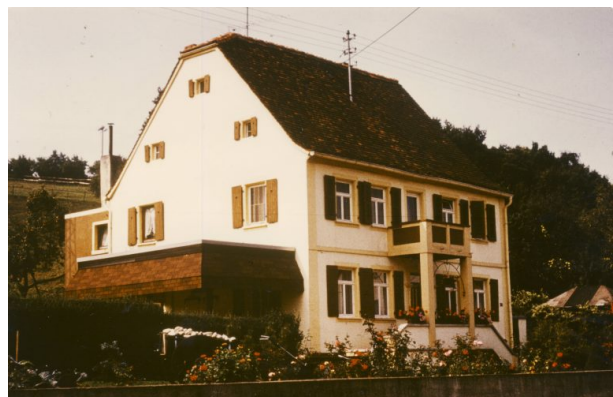
Altes Pfarrhaus in der Hauptstraße 50 in Hinzweiler