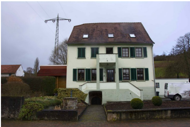
Altes Pfarrhaus in der Hauptstraße 50 in Hinzweiler (Sonja Kasprick, 2020)