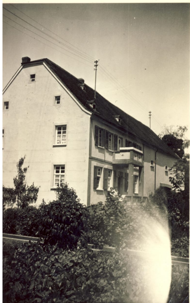
Altes Pfarrhaus mit angebauter Scheune in der Hauptstraße 50 in Hinzweiler (OG Hinzweiler/Werner Lang, 1960)