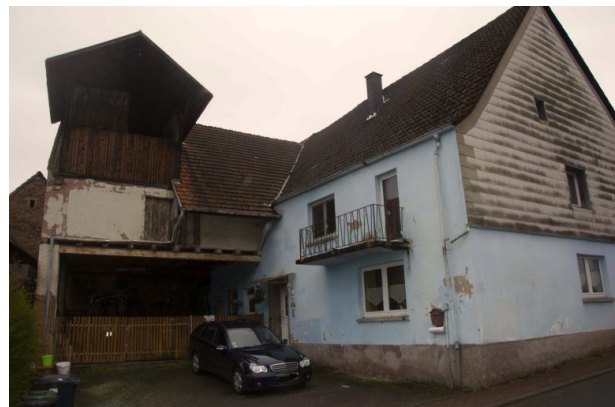
Ehemaliges Bauernhaus Luije Hauptstraße 43 in Hinzweiler (Sonja Kasprick, 2020)