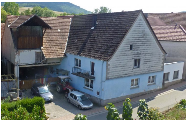
Ehemaliges Bauernhaus Luije Hauptstraße 43 in Hinzweiler (OG Hinzweiler/ Werner Lang, 2015)