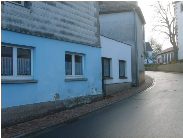
Früherer Anbau der Raiffeisengenossenschaft (OG Hinzweiler/ Werner Lang, 2015)