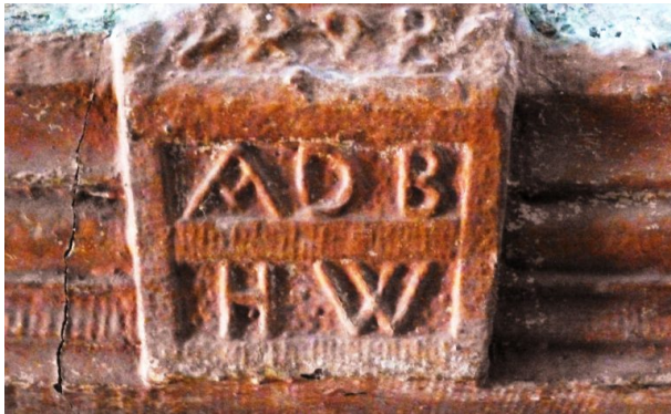
Türinschrift über der alten Haustür (OG Hinzweiler/ Werner Lang)