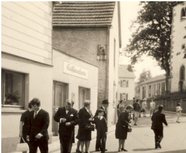
Anbau der Raiffeisengenossenschaft (OG Hinzweiler/ Werner Lang, 1970)