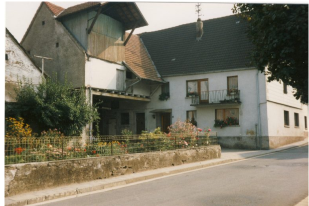
Ehemaliges Bauernhaus Luije Hauptstraße 43 in Hinzweiler (OG Hinzweiler/ Werner Lang, 1980)