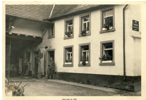
Ehemaliges Bauernhaus Luije Hauptstraße 43. Vor der Haustür ein Wehrmachtsoldat (OG Hinzweiler/ Werner Lang, 1942)