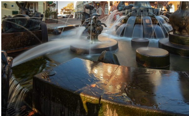
Brunnenelement Opelmotor auf dem Kaiserbrunnen (Harald Kröher, 2018)