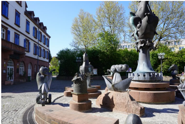
Bienenstock, Auswandererschiff und Pferderrüstung auf dem Kaiserbrunnen Kaiserslautern (Dana Taylor, 2020)