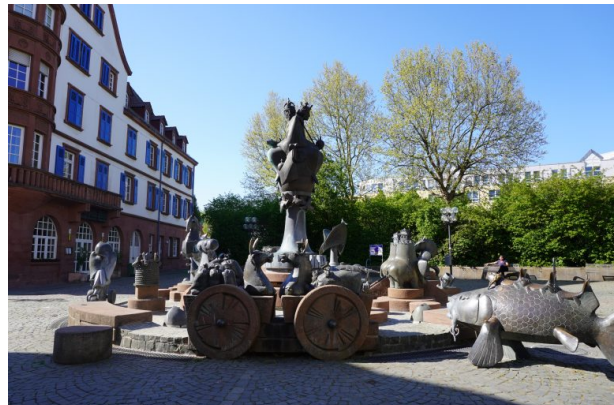
Kaiserbrunnen in Kaiserslautern (Dana Taylor, 2020)