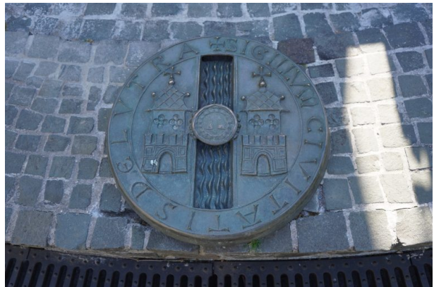
Stadtswappen der Stadt Kaiserslautern auf dem Kaiserbrunnen (Dana Taylor, 2020)