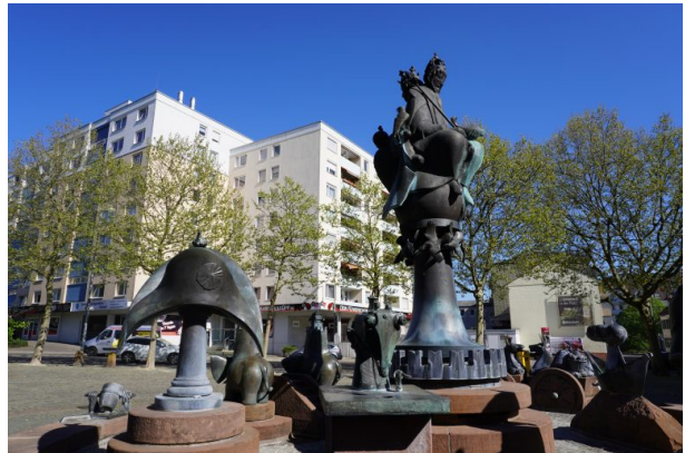
Kaiser und König sowie Napolenhut und Pfaffnähmaschine auf dem Kaiserbrunnen Kaiserslautern (Dana Taylor, 2020)