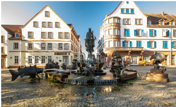
Kaiserbrunnen in Kaiserslautern (Harald Kröher, 2018)

Dana Taylor am 02.06.2020 um 08:52:18Uhr