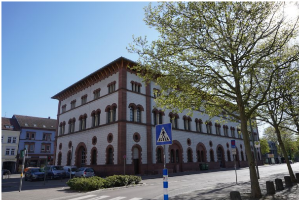
Fruchthalle in Kaiserslautern (Dana Taylor, 2020)

Dana Taylor am 02.06.2020 um 13:23:26Uhr