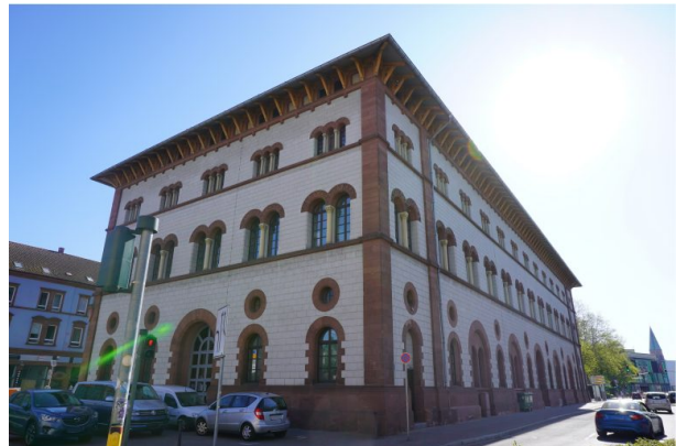
Ansicht von der Martin-Luther-Straße auf die Fruchthalle (Dana Taylor, 2020)