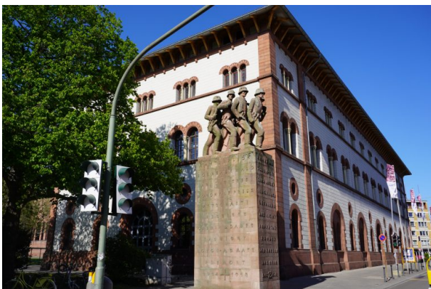
Kriegerdenkmal vor der Fruchthalle in Kaiserslautern (Dana Taylor, 2020)