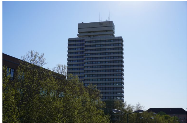
Rathaus in Kaiserslautern (Dana Taylor , 2020)