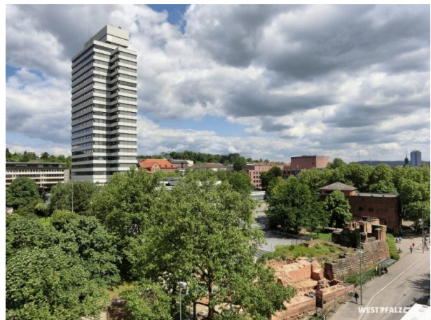
Im Hintergrund das Rathaus und im Vordergrund die Reste der Kaiserpfalz und des Casimirschlosses (Christian Weidler, 2015)