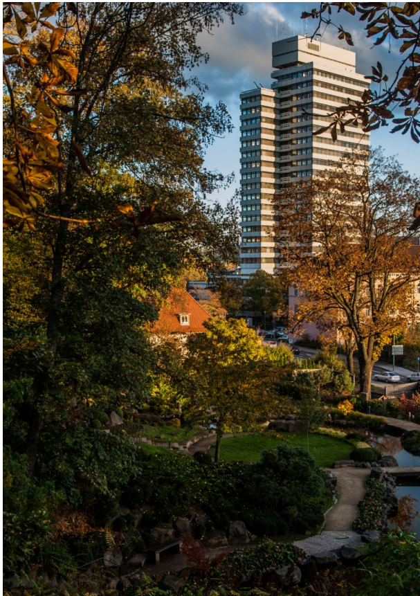
Blick auf das Rathaus in Kaiserslautern vom Japanischen Garten aus (Ralf Keller, 2013)