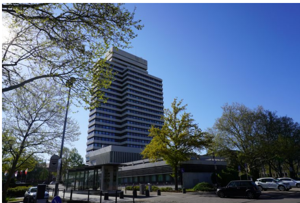
Rathaus in Kaiserslautern (Dana Taylor, 2020)

Dana Taylor am 02.06.2020 um 12:22:04Uhr