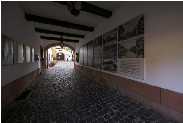
Gang zum Innenhof des Museums (Harald Kröher, 2018)