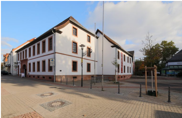
Außenansicht des Theodor-Zink-Museums in Kaiserslautern (Harald Kröher, 2018)

Dana Taylor am 02.06.2020 um 10:17:37Uhr