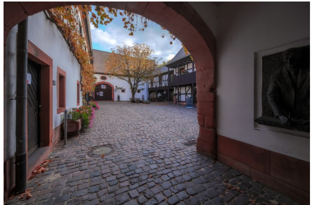
Blick in den Innenhof des Museums (Harald Kröher, 2018)