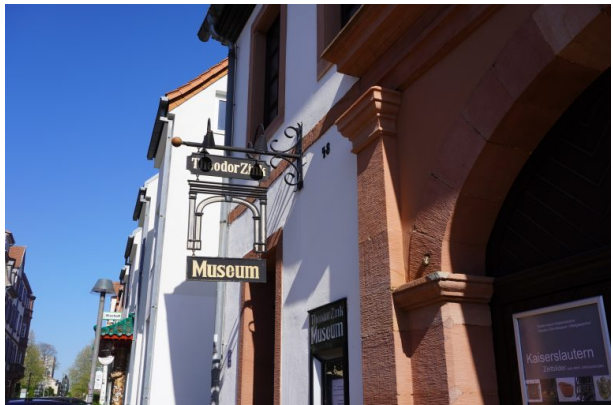
Schild des Theodor-Zink-Museum Kaiserslautern (Dana Taylor, 2020)