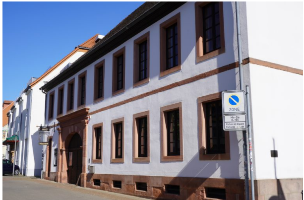
Theodor-Zink-Museum in Kaiserslautern (Dana Taylor, 2020)