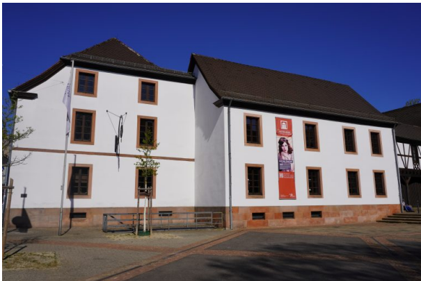
Ansicht von der Steinstraße auf das Haus Rheinkreis (Dana Taylor, 2020)