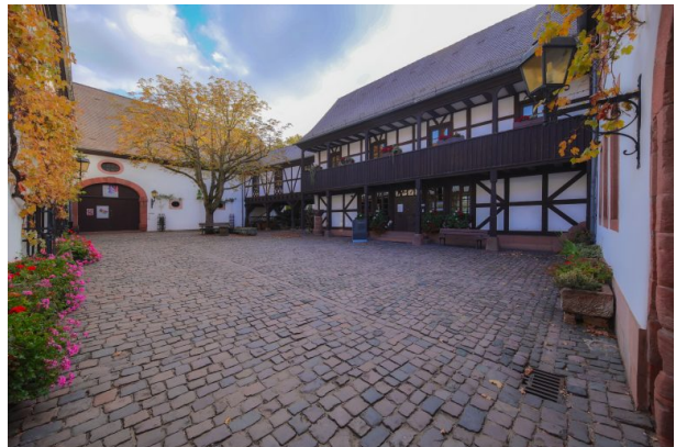
Innenhof des Theodor-Zink-Museums (Harald Kröher, 2018)