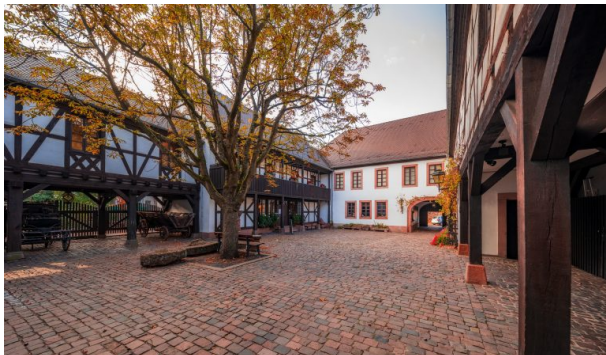
Innenhof des Theodor-Zink-Museums (Harald Kröher, 2018)