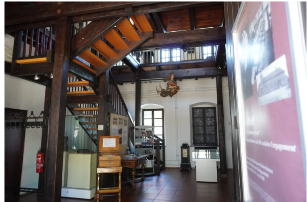
Innenansicht des Wadgasserhof in Kaiserslautern (Dana Taylor, 2020)