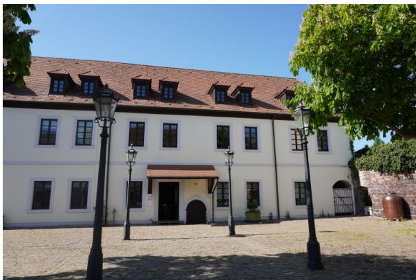
Wadgasserhof in Kaiserslautern (Dana Taylor, 2020)

Dana Taylor am 02.06.2020 um 10:31:53Uhr