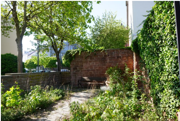
Kräutergarten des Wadgasserhof (Dana Taylor, 2020)