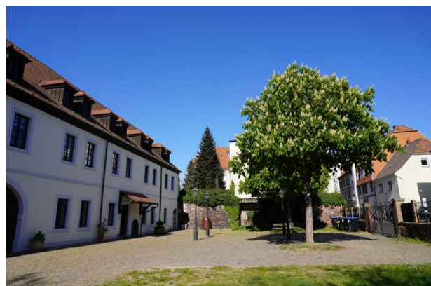
Innenhof des Wadgasserhof in Kaiserslautern (Dana Taylor, 2020)