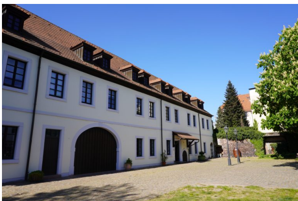
Wadgasserhof in Kaiserslautern (Dana Taylor, 2020)