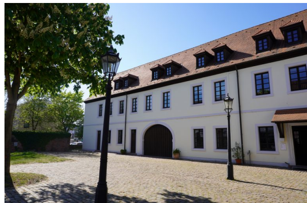
Wadgasserhof in Kaiserslautern (Dana Taylor, 2020)