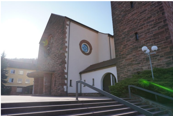
Eingang zur Heilig-Geist-Kirche (Dana Taylor, 2020)