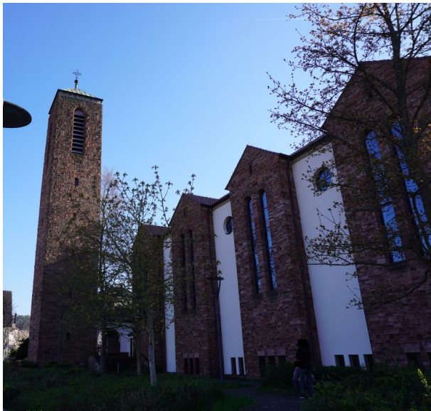
Katholische Pfarrkirche Heilig-Geist in Landstuhl (Dana Taylor, 2020)

Dana Taylor am 25.05.2020 um 16:07:15Uhr