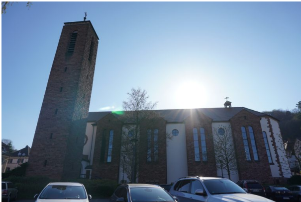
Seitenansicht der Heilig-Geist-Kirche in Landstuhl (Dana Taylor, 2020)