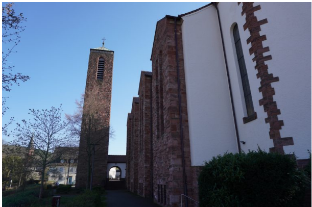
Katholische Pfarrkirche Heilig-Geist in Landstuhl (Dana Taylor, 2020)