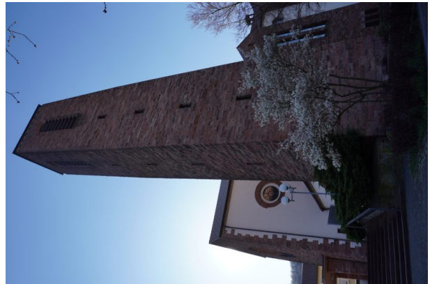
Kirchturm der Heilig-Geist-Kirche in Landstuhl (Dana Taylor, 2020)