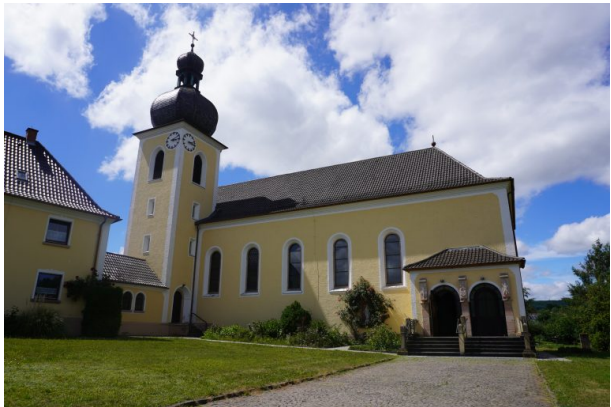
Frontansicht der katholischen Kirche in Kottweiler-Schwanden (Dana Taylor, 2020)