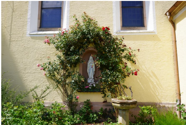
Mariengrotte an der katholischen Kirche in Kottweiler-Schwanden (Dana Taylor, 2020)