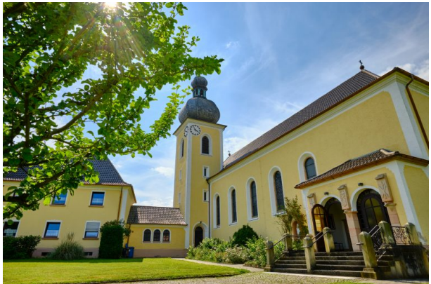
Katholische Kirche in Kottweiler-Schwanden (Torben Fruth, 2021)