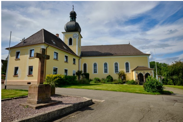
Katholische Kirche in Kottweiler-Schwanden (Torben Fruth, 2021)

Dana Taylor am 06.07.2020 um 08:32:19Uhr