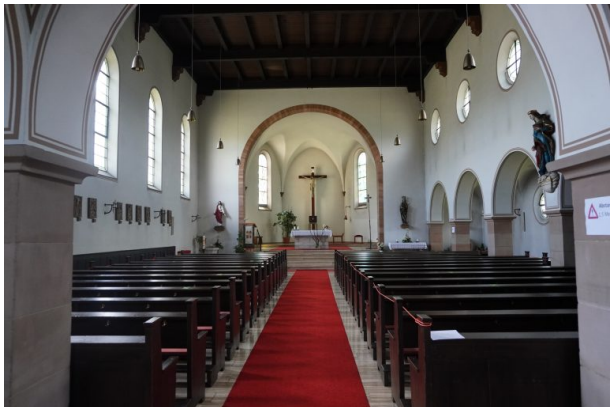
Innenansicht der katholischen Kirche in Kottweiler-Schwanden (Dana Taylor, 2020)