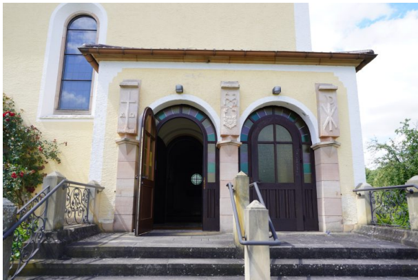
Eingangsbereich der katholischen Kirche in Kottweiler-Schwanden (Dana Taylor, 2020)