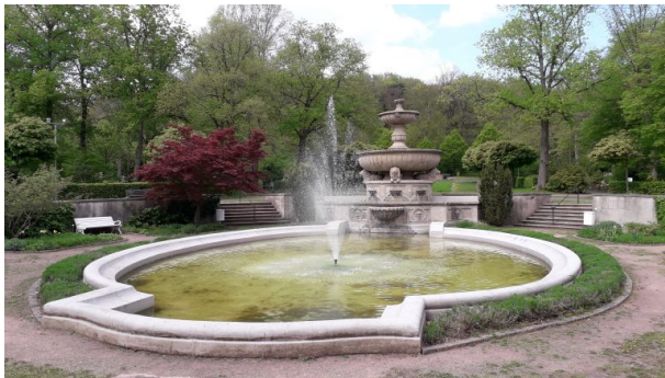
Löwenbrunnen in Kaiserslautern (Dr. Hans-Günther Clev, 2019)

Dana Taylor am 24.08.2020 um 08:38:03Uhr