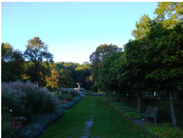
Blick auf den Löwenbrunnen auf dem Hauptfriedhof in Kaiserslautern (Arne Schwöbel, 2015)