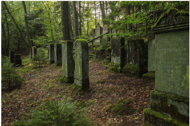
Jüdischer Friedhof in der Zeppelinstraße in Pirmasens (Harald Kröher , 2018)