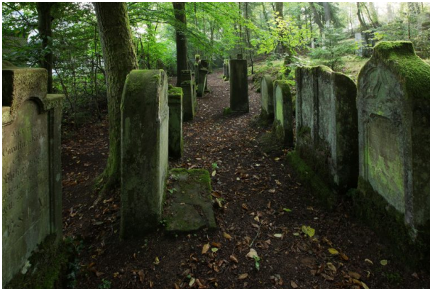
Jüdischer Friedhof in der Zeppelinstraße in Pirmasens (Harald Kröher , 2018)