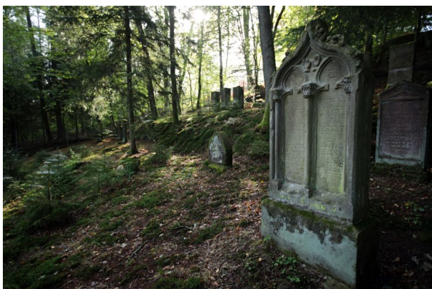
Jüdischer Friedhof in der Zeppelinstraße in Pirmasens (Harald Kröher , 2018)

Dana Taylor am 24.08.2020 um 10:03:03Uhr