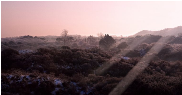
Mehlinger Heide bei Sonnenuntergang (Harald Kröher, 2012)