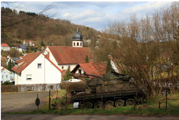
Panzer am Westwallmuseum in Niedersimten (Dennis Schneble, 2015)

Dana Taylor am 10.11.2020 um 16:26:44Uhr