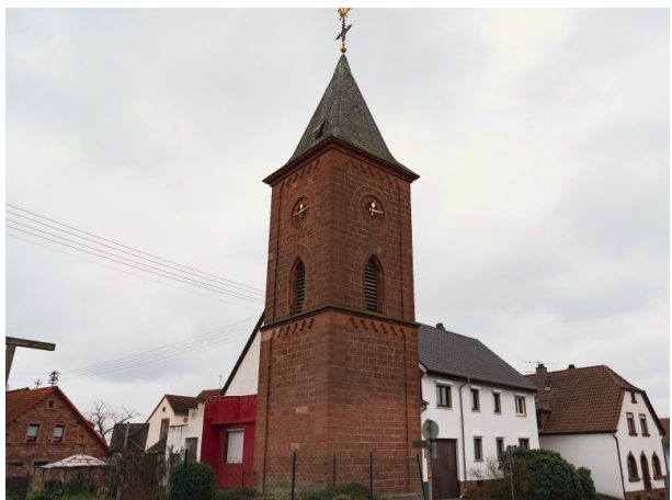
Glockenturm in Kottweiler (Dana Taylor, 2021)