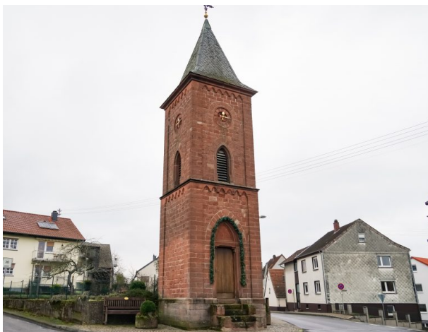
Glockenturm in Kottweiler (Dana Taylor, 2021)

Dana Taylor am 12.01.2021 um 08:25:02Uhr