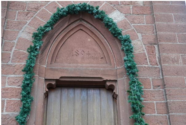
Türinschrift im Glockenturm in Kottweiler (Dana Taylor, 2021)