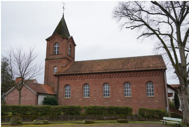
Seitenansicht der katholischen Kirche in Obermohr (Dana Taylor, 2021)