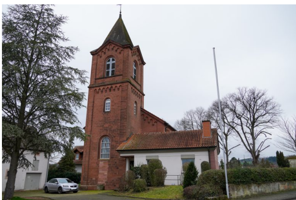
Kirchturm der katholischen Kirche in Obermohr (Dana Taylor, 2021)