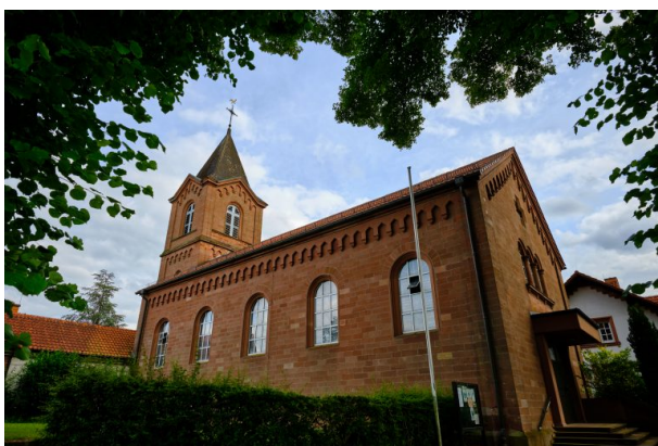
Die katholische Kirche in Obermohr (Torben Fruth, 2021)

Dana Taylor am 19.01.2021 um 09:33:39Uhr