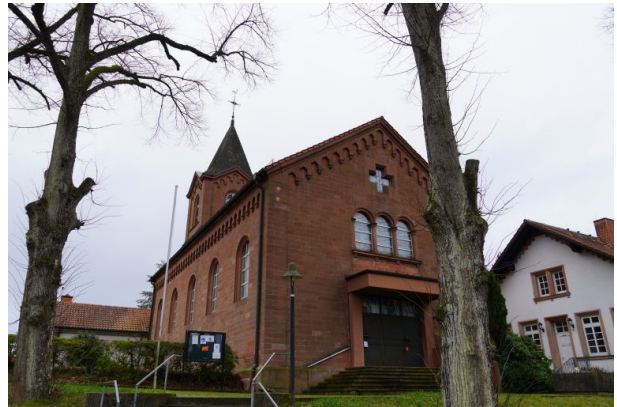
Frontansicht der katholischen Kirche in Obermohr