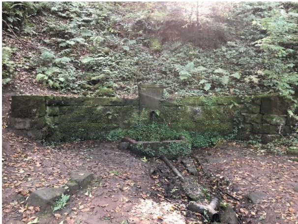
Teufelsbrunnen im Gersbachtal bei Pirmasens-Niedersimten (Dana Taylor, 2021)