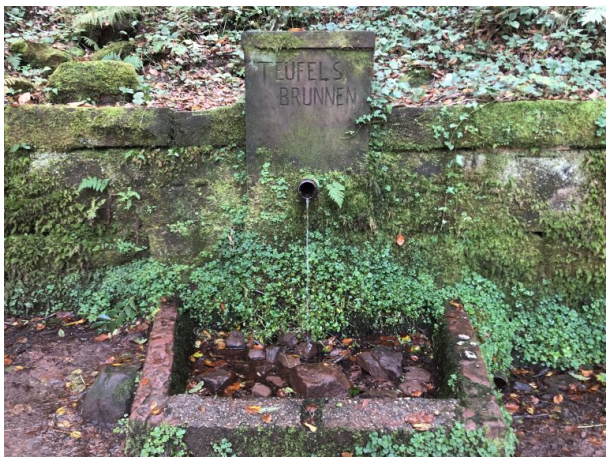
Teufelsbrunnen im Gersbachtal bei Pirmasens-Niedersimten (Dana Taylor, 2021)

Dana Taylor am 20.04.2021 um 09:45:38Uhr