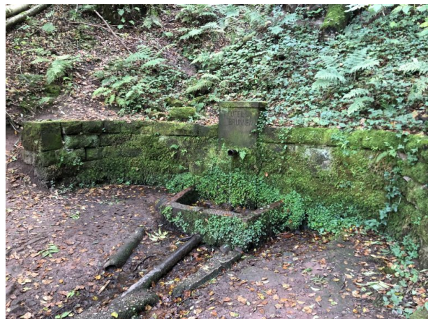
Teufelsbrunnen im Gersbachtal bei Pirmasens-Niedersimten