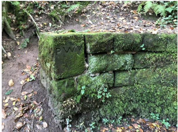
Teufelsbrunnen im Gersbachtal bei Pirmasens-Niedersimten (Dana Taylor, 2021)