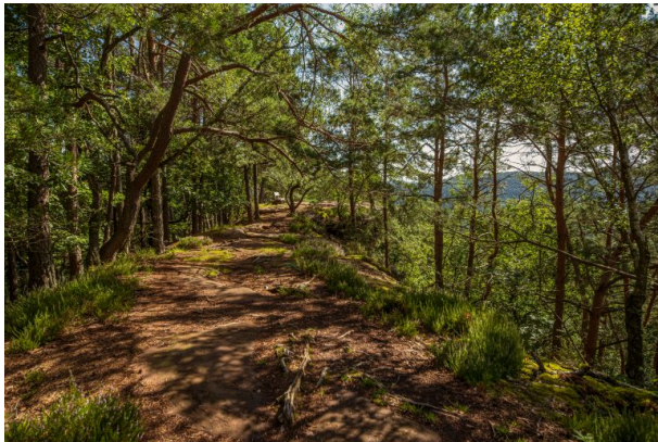
Kühhungerfelsen bei Schwanheim