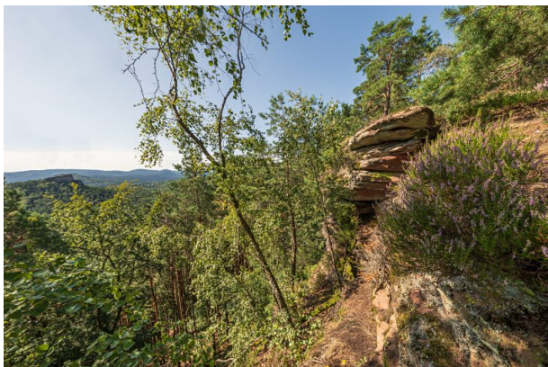
Kühnhungerfelsen bei Schwanheim (Harald Kröher, 2021)