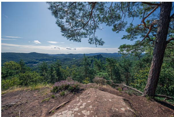
Kühnhungerfelsen bei Schwanheim (Harald Kröher, 2021)

Dana Taylor am 27.04.2021 um 09:35:49Uhr