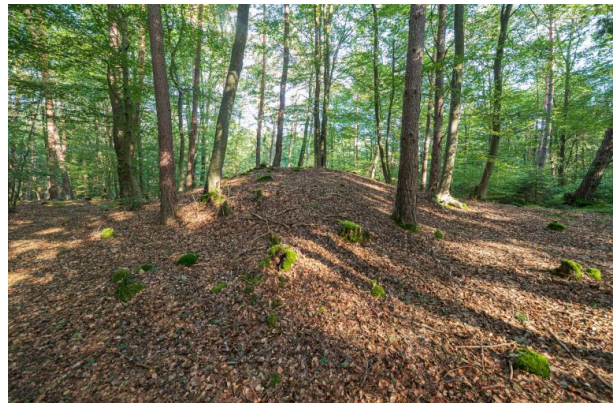
Keltische Hügelgräber bei Mehlingen in der Waldabteilung "Budel"