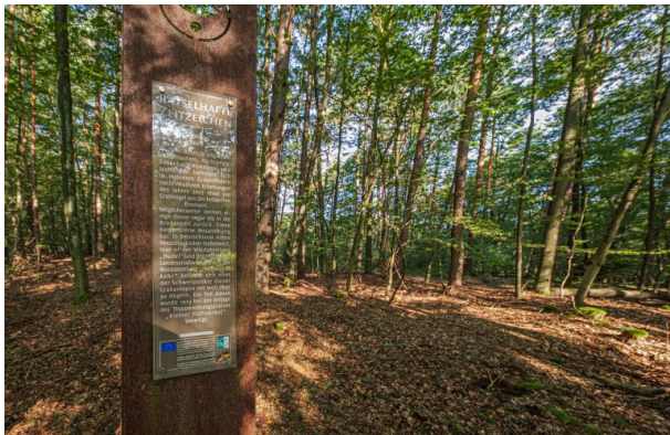
Keltische Hügelgräber bei Mehlingen in der Waldabteilung "Budel" (Harald Kröher, 2021)

Dana Taylor am 27.04.2021 um 10:19:54Uhr