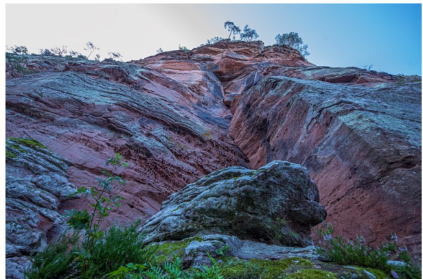
Büttelfels bei Dahn (Harald Kröher, 2021)