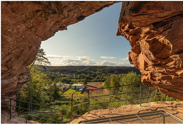
Felsloch mit Aussichtsplattform mit Blick auf den benachbarten Lämmerfelsen (Harald Kröher, 2021)