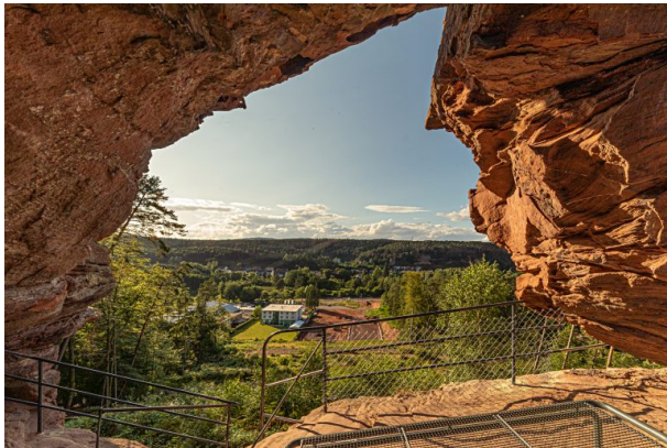
Felsloch mit Aussichtsplattform mit Blick auf den benachbarten Lämmerfelsen (Harald Kröher, 2021)