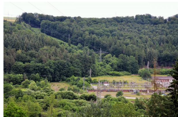
Blick auf einen Teil der früheren Lagerfläche. Heute sind die Pfalzwerke hier ansässig. Betonierete Bodenplatten am Rand des Geländes dürften noch aus der früheren Lagerzeit stammen. (Dr. Hans-Günther Clev , 2021)