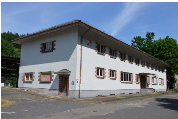
Bahnhof Pirmasens-Nord (Biebermühle) heute