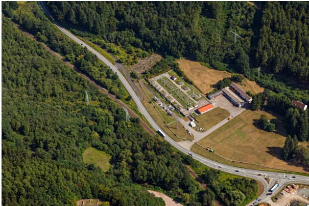
Luftaufnahme der Biebermühle und dem früheren Standort des Lagers

Dana Taylor am 06.07.2021 um 10:57:49Uhr