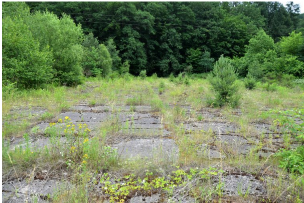
Betonierte Bodenplatten am Rand des Pfalzwerke-Geländes aus der früheren Lagerzeit (Dr. Hans-Günther Clev , 2021)