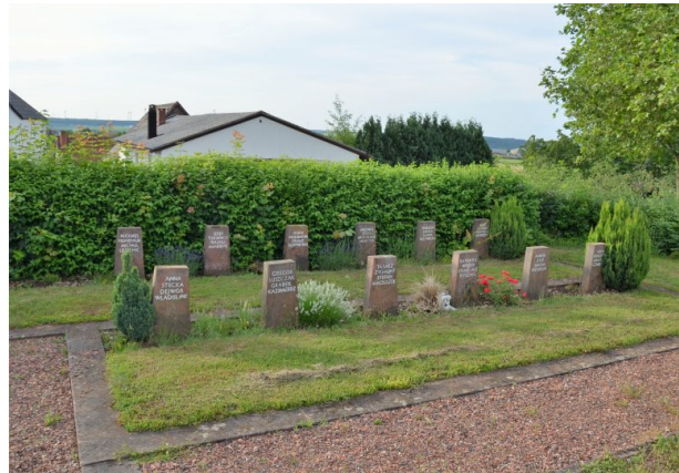
Erhaltene Gräber polnischer Lagerinsassen auf dem Friedhof Donsieders (Dr. Hans-Günther Clev , 2021)