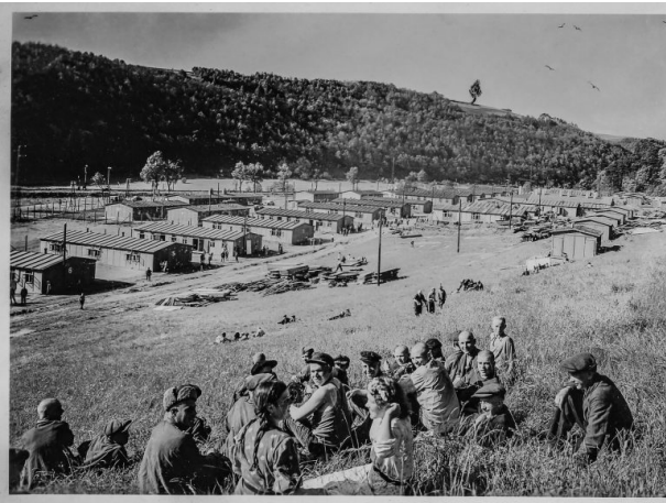
Zwangsarbeiter und Zwangsarbeiterinnen vor dem Lager "Biebermühle" bei Pirmasens um 1942/43 (Sammlung Privatarhiv Bernd Stephan, 1942/43)