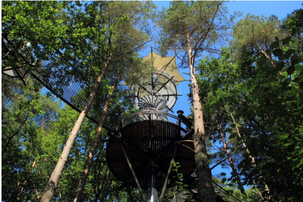
Zentraler Aussichtsturm des Baumwipfelpfades am Biosphärenhaus Fischbach (Dennis Schneble, 2012)