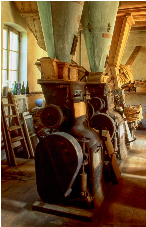
Mahlwerk der Rosselmühle bei Thaleischweiler-Fröschen (Bernd Wagner, 2018)