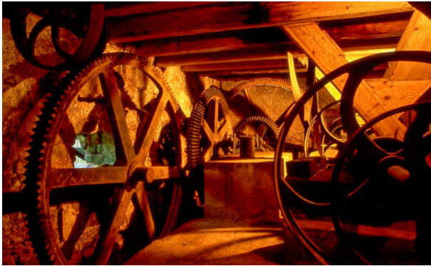
Mühlradgetriebe der Rosselmühle bei Thaleischweiler-Fröschen (Bernd Wagner, 2018)