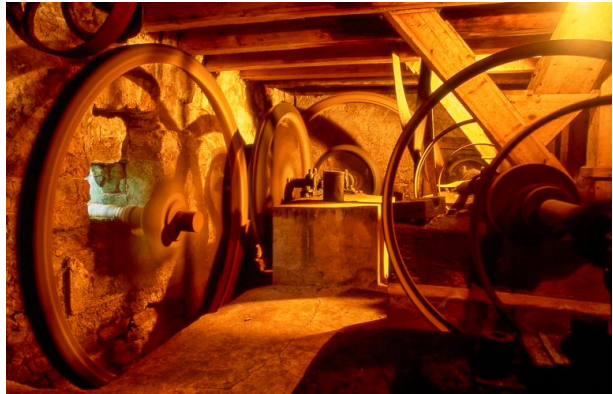
Zahnräder der Rosselmühle bei Thaleischweiler-Fröschen (Bernd Wagner, 2018)