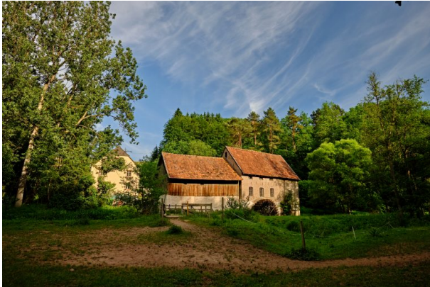
Die Rosselmühle bei Thaleischweiler-Fröschen (Torben Fruth, 2021)