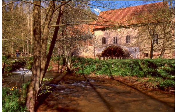
Außenansicht der Rosselmühle bei Thaleischweiler-Fröschen (Bernd Wagner, 2018)