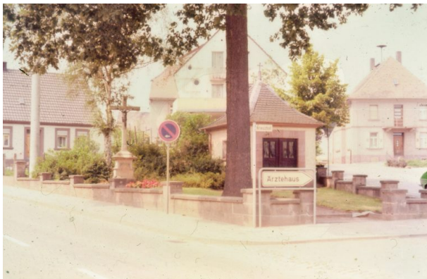
Blick auf die Kreuzhofkapelle (Willi Heinz, ca. 1980)

Dana Taylor am 22.03.2024 um 13:23:10Uhr